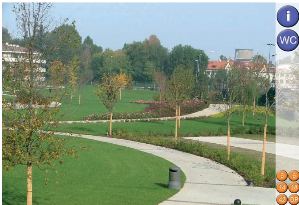
PARCO DI VIA VENEZIA 45.000 mq - via Venezia/Maroncelli

Tra gli ampi spazi verdi, che accolgono le numerose piante e le aiuole fiorite, nascerà, a breve, un giardino d'inverno con una serra per la coltivazione e l'esposizione di piante grasse.