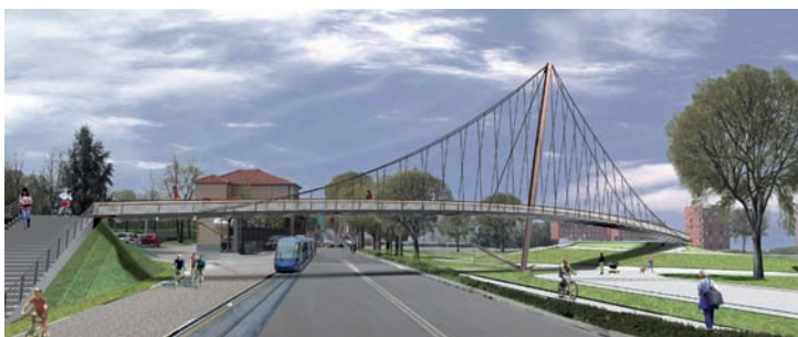
PASSERELLA DI VIA VENEZIA 76 m - prospetto

di via Venezia 5, che nel prossimo futuro sarà collegato al fiume attraverso una passerella ciclopedonale.