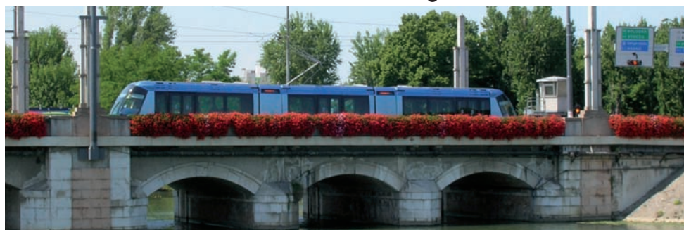
CASCATA DI GERANI SUL PONTE DEL BASSANELLO

È un itinerario per chi desidera trascorrere del tempo a contatto con la natura nel verde cittadino e svolgere attività fisica.