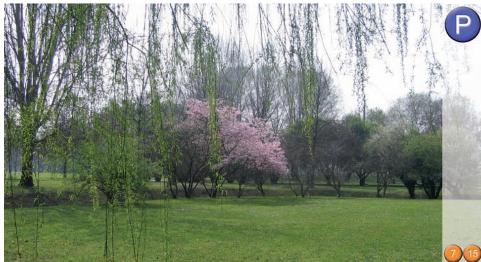
PARCO DEL RONCAJETTE 95.000 mq - via Sant'Orsola Vecchia

➔ Dal ponte di Terranegra si procede fino al ponte S. Gregorio e, raggiunta via Vigonovese, si prosegue a destra verso il parco del Roncajette 3 , un ampio “cuscinetto verde” nella zona industriale di Padova.