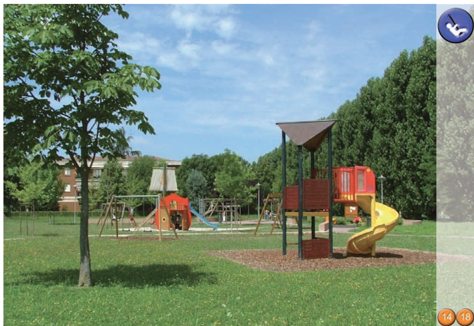
GIARDINO DEL SOLE 8.000 mq - via F.lli Cervi

Si trova a Ponte di Brenta ed è particolarmente frequentato dai bambini per i numerosi giochi e attrezzature, soprattutto per i più piccoli. Inoltre la presenza di due pergole di legno con alcune panchine rende il giardino accogliente anche per i più grandi.