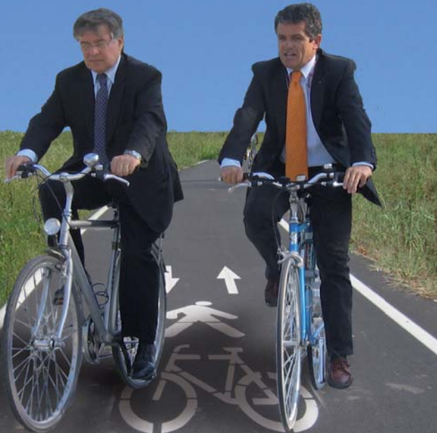
Ivo Rossi Assessore alla Mobilità, verde pubblico, arredo urbano, città metropolitana e comunicazione