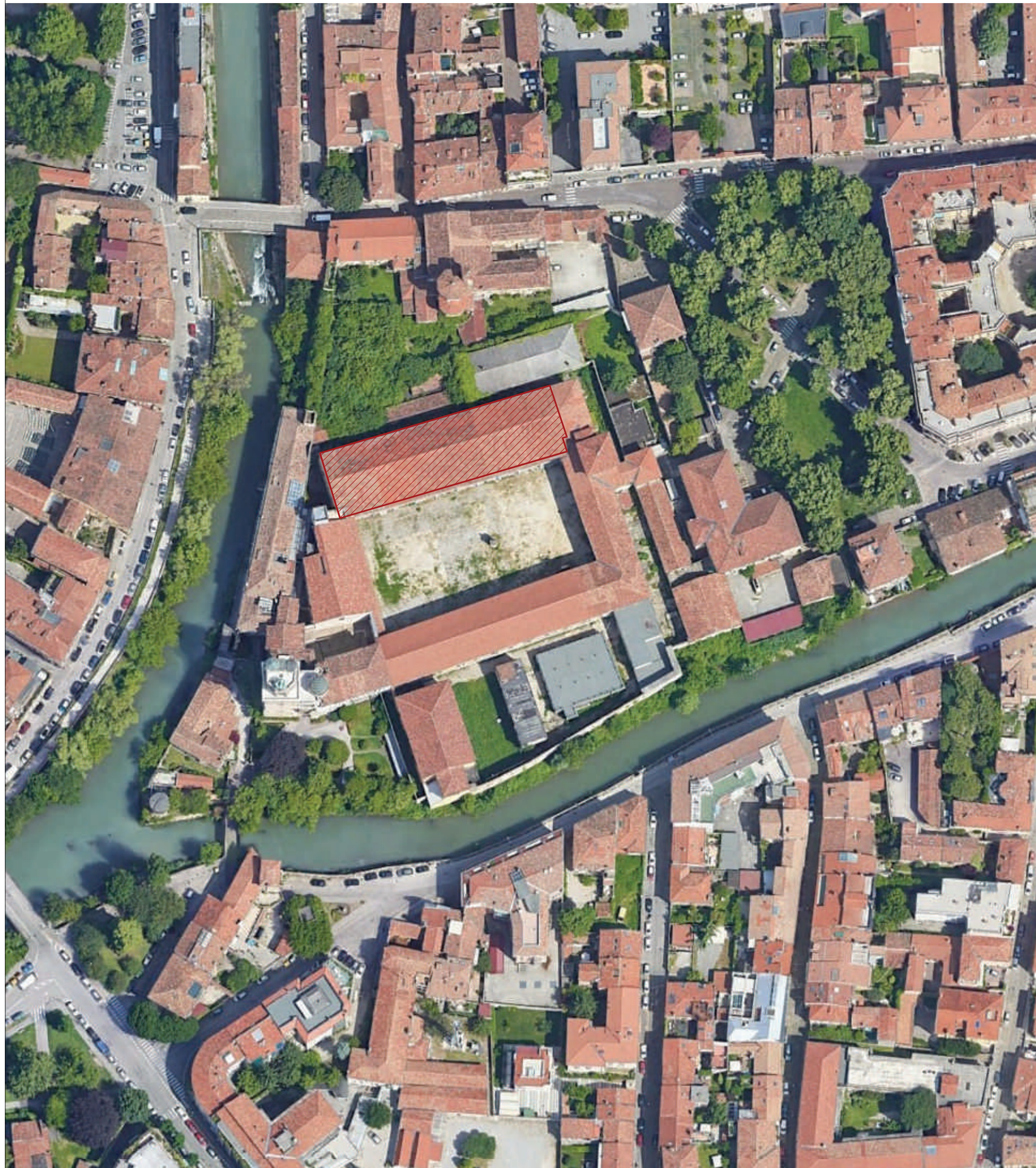
Ortofoto scala 1:1000