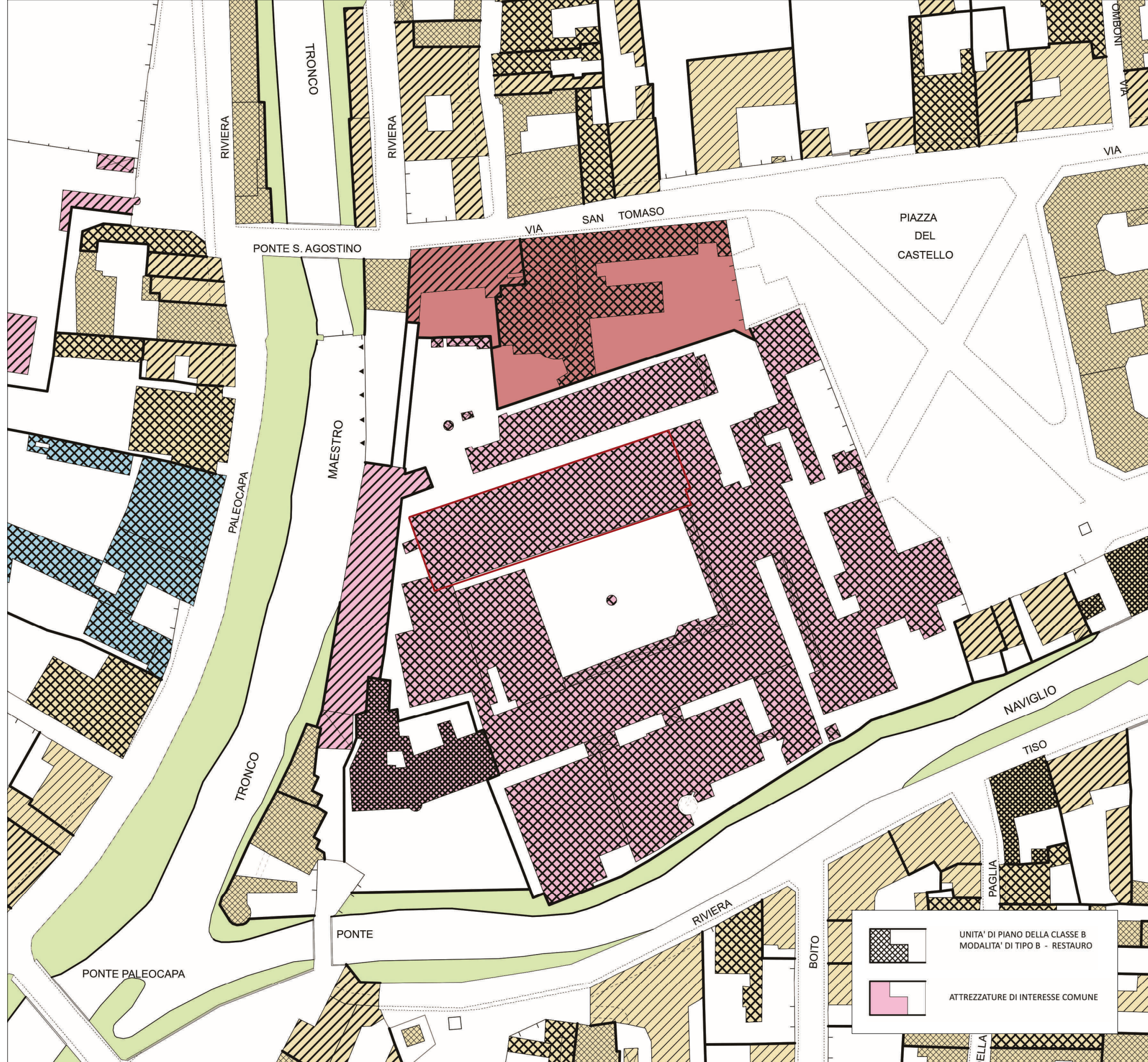
Estratto P.I. scala 1:1000