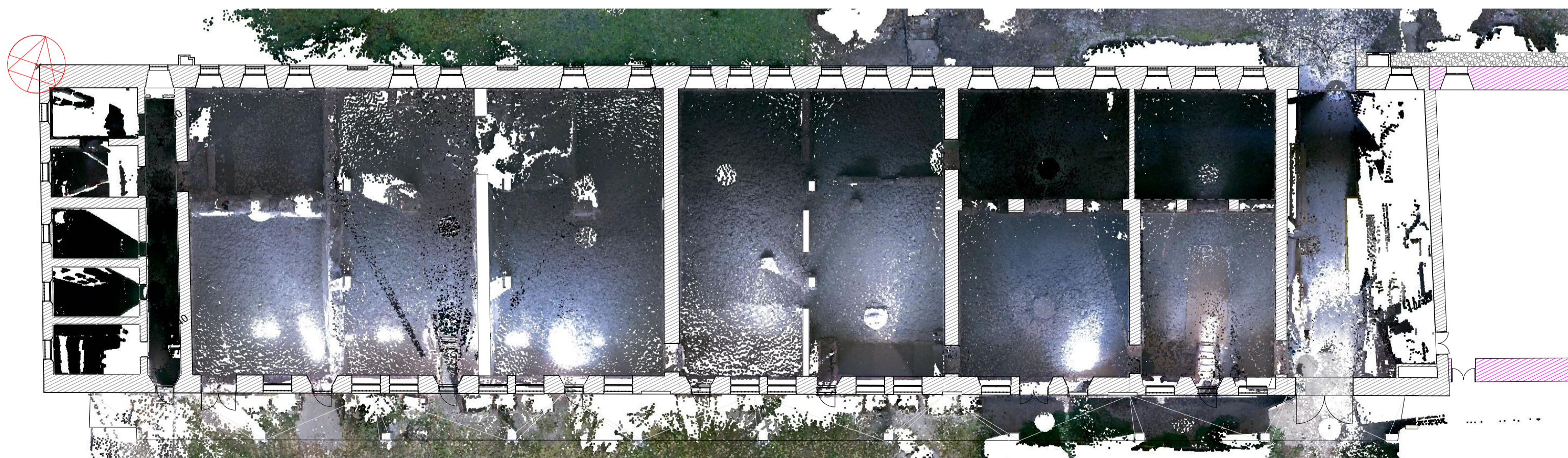
PC Piano Terra (sovrapposto) 1:200