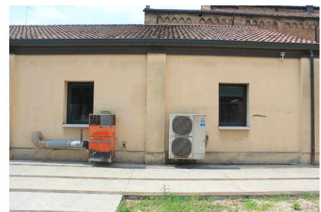
Fotografia dei terminali impiantistici da mascherare con S15