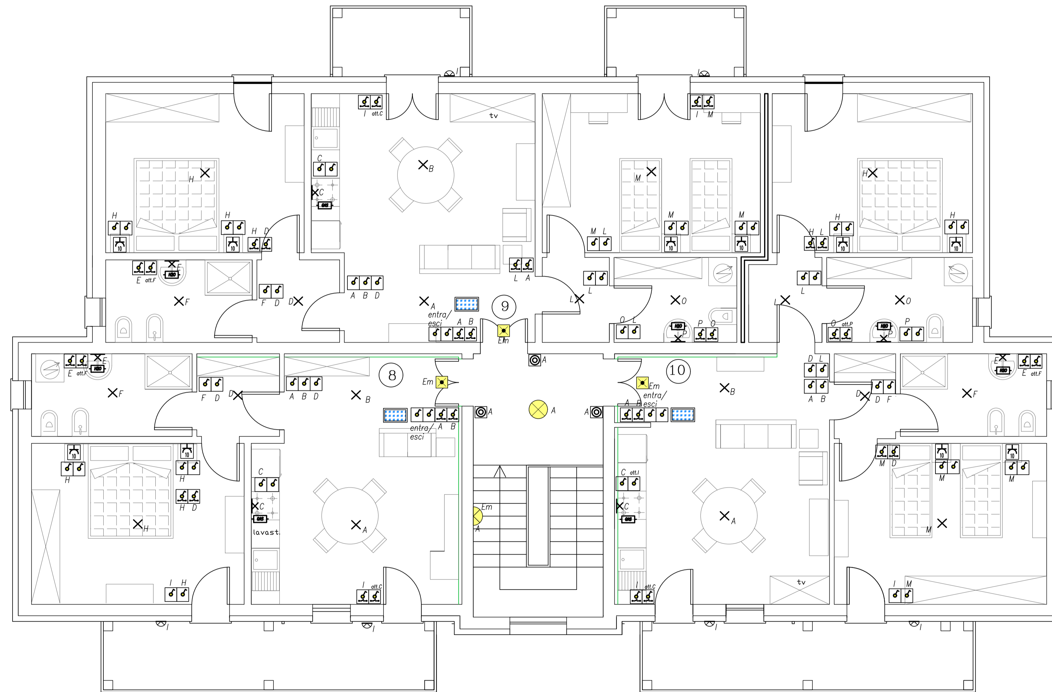
PIANTA PIANO SECONDO