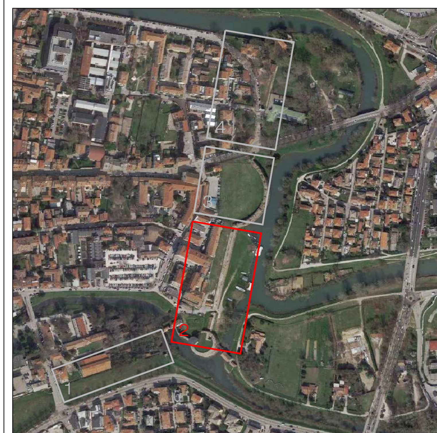
Ortofoto con evidenziate le aree d'intervento