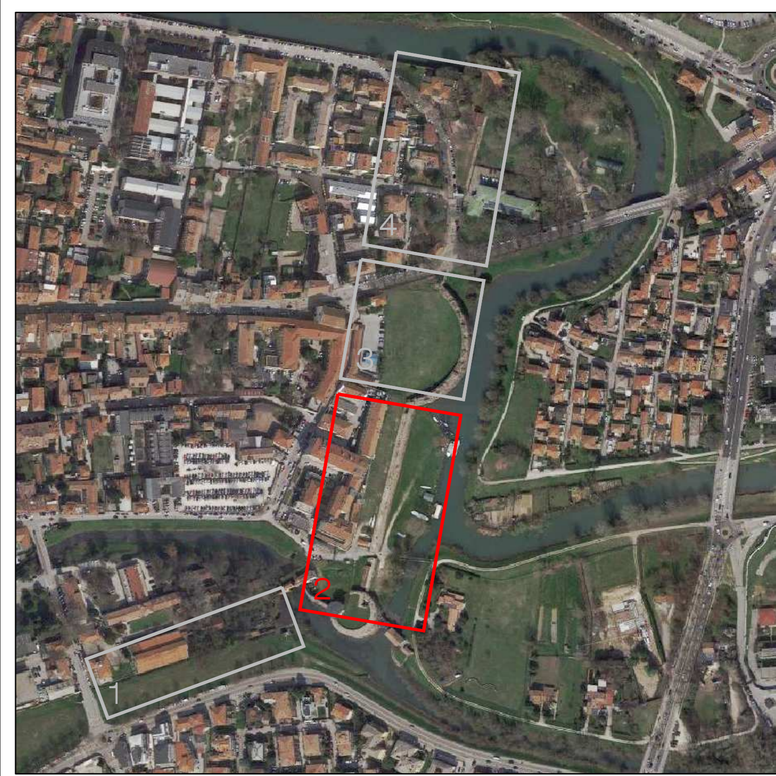
Ortofotografia con evidenziata l'area d'intervento