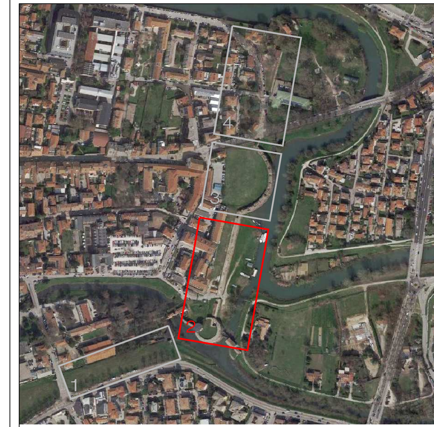
Ortofoto con evidenziata l'area d'intervento