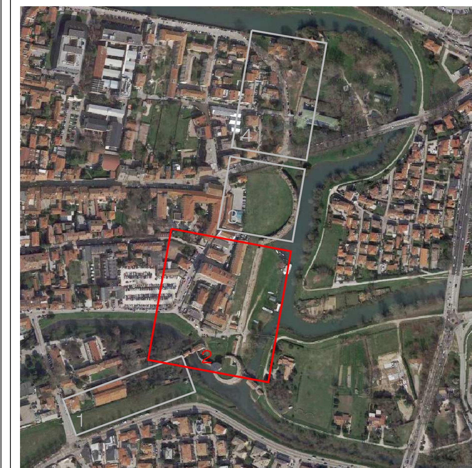
Ortofoto con evidenziate le aree d'intervento