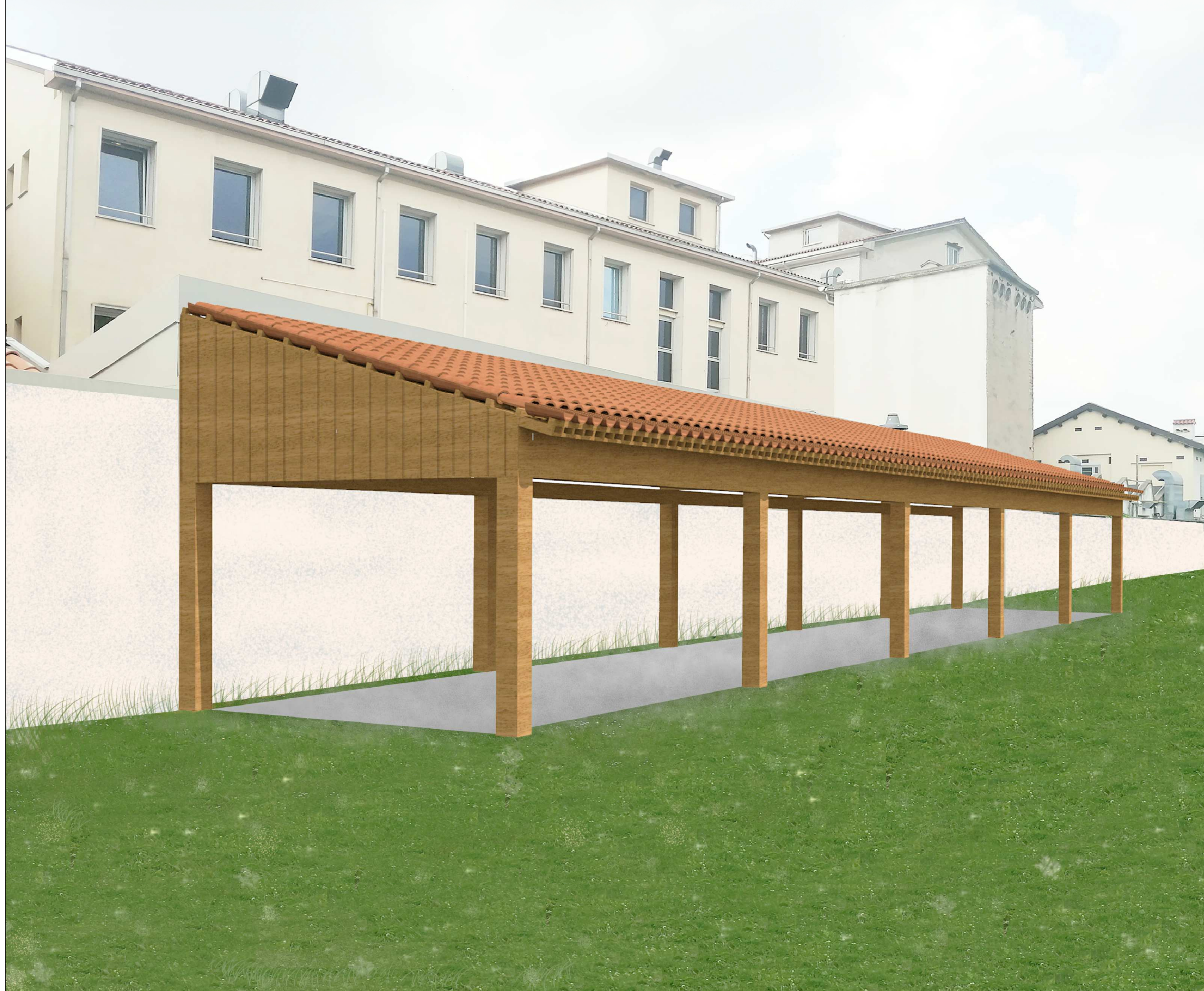
PORTICATO PER LA MANUTENZIONE DELLE BARCHE