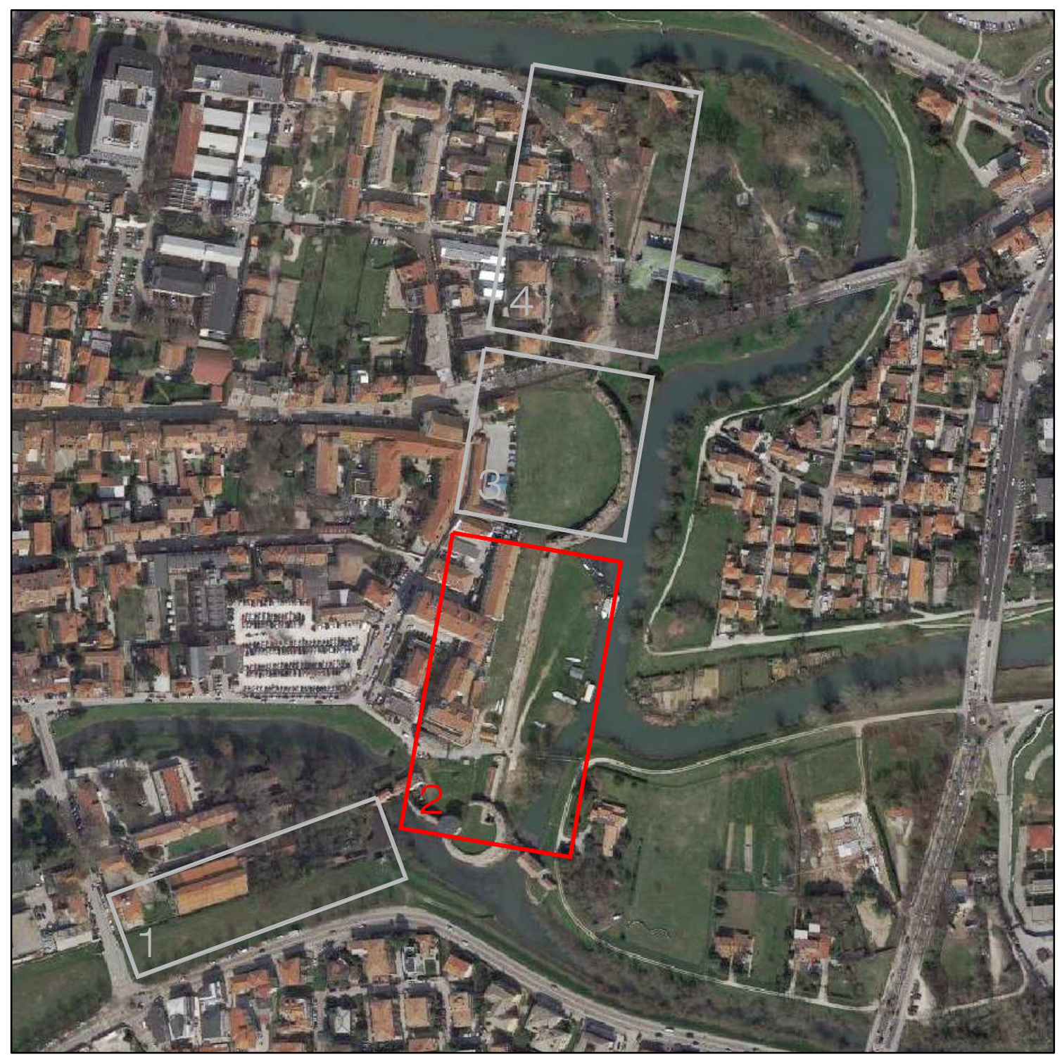
Ortofoto con evidenziata l'area d'intervento