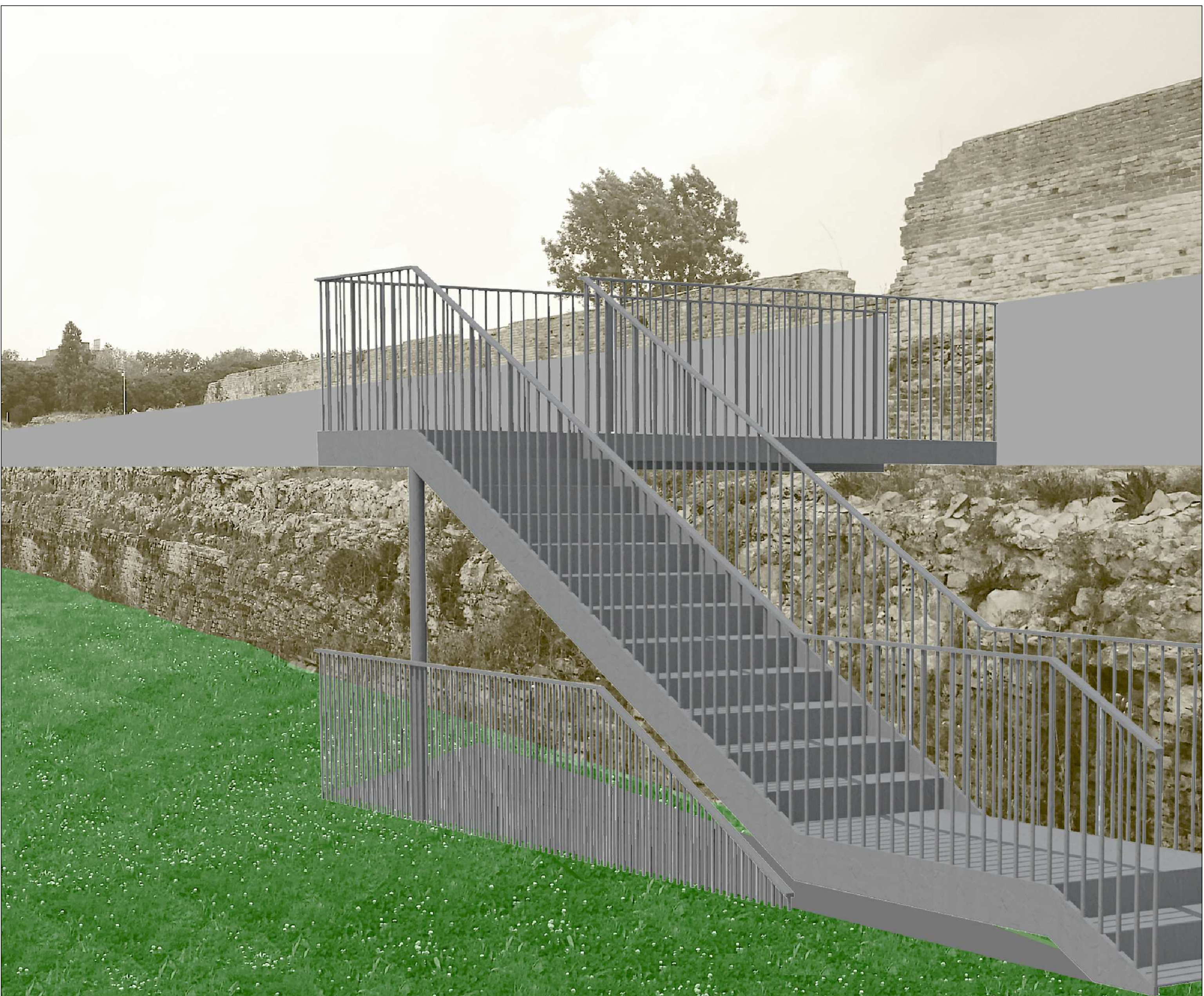
SCALA DI ACCESSO AL PERCORSO DI RONDA