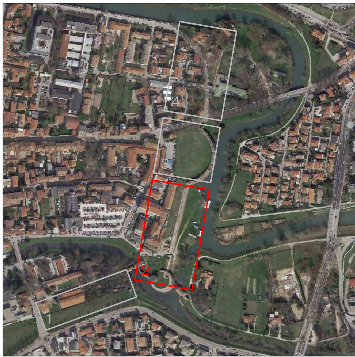
Ortofoto con evidenziata l'area d'intervento

Archeo Ed srl Via S. Francesco, 89 35121 Padova - Italia Tel. +39 049 652380 Fax +39 049 652747 e-mail: archeoed@archeoed.it