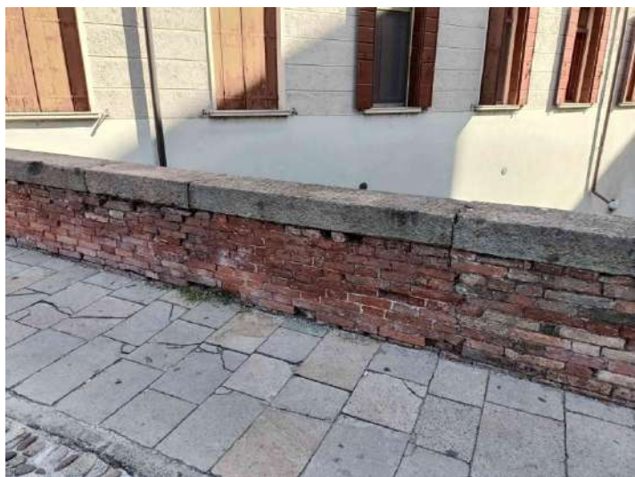
F08: Parapetto interno di monte