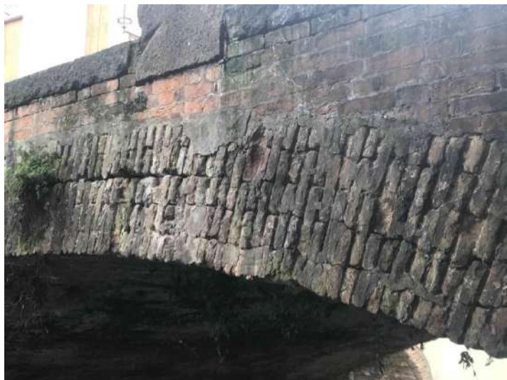
F06: Arcata parapetto e copertina di monte