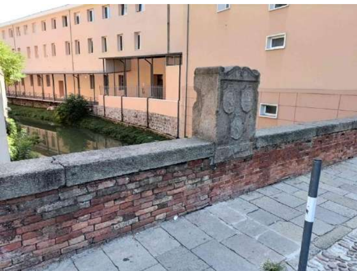
F07: Parapetto, copertine e lapide di monte