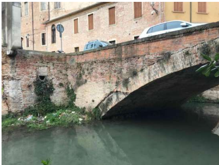
F05: Arcata timpano e parapetto di valle con parziale crollo armilla