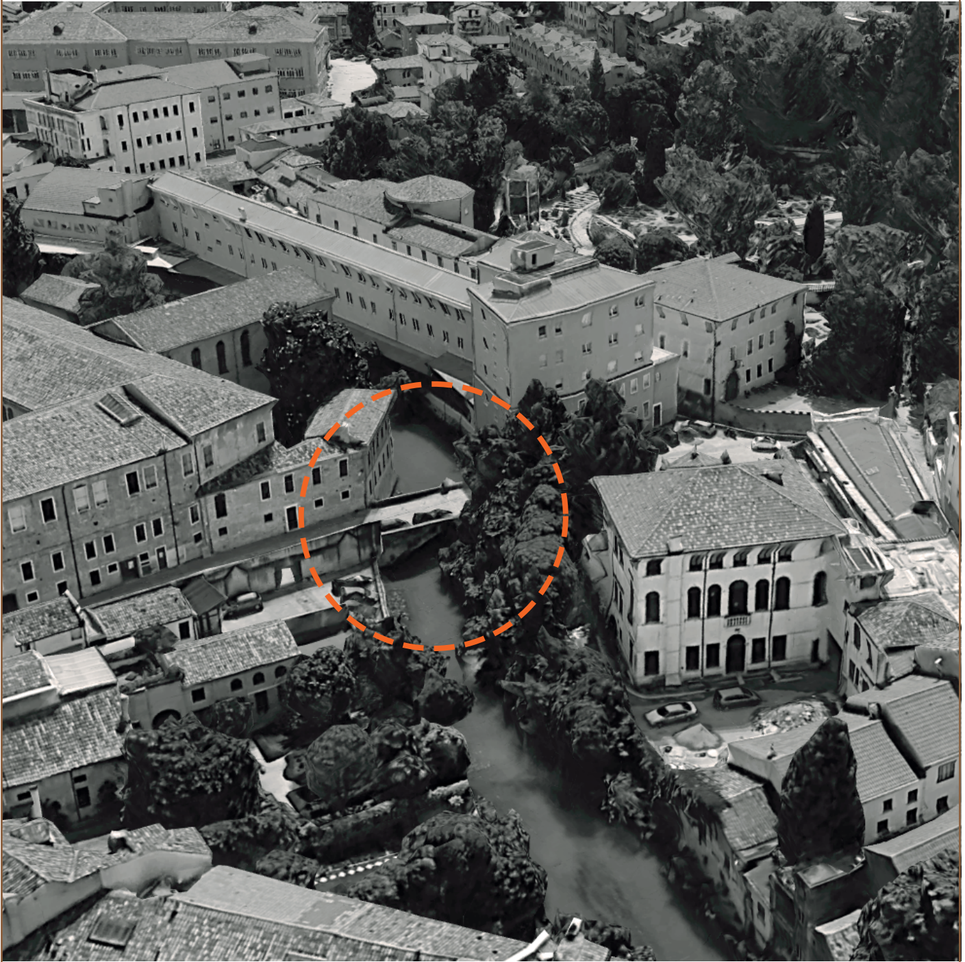
PONTE DEL MAGLIO