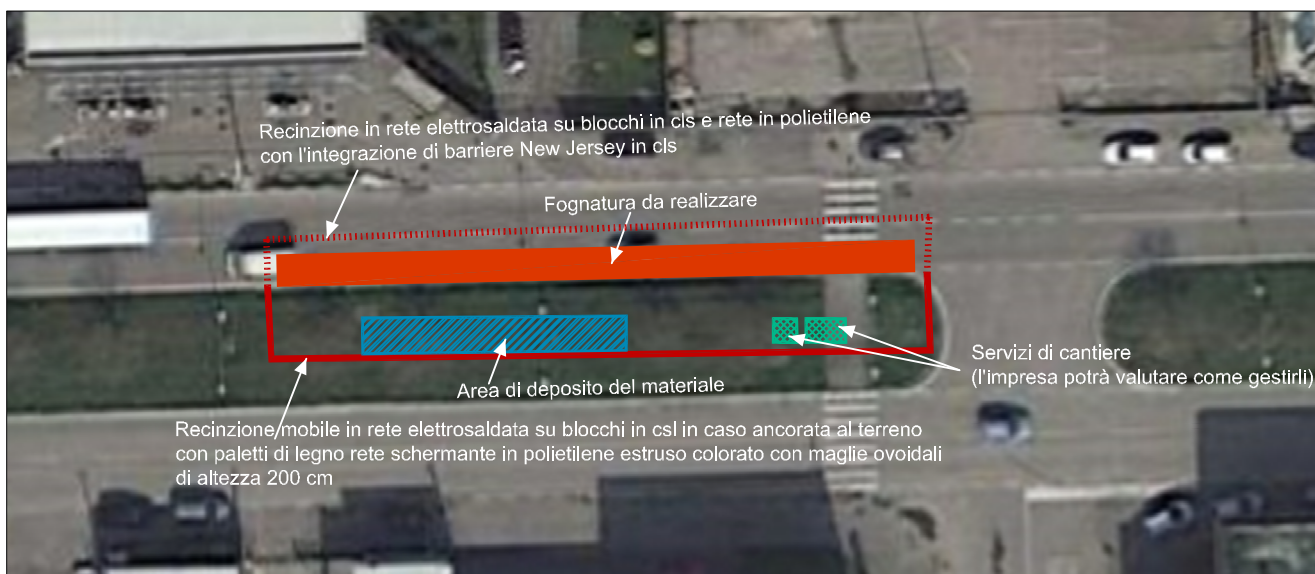
Esempio di cantiere da realizzare per ogni fase di avanzamento dei lavori