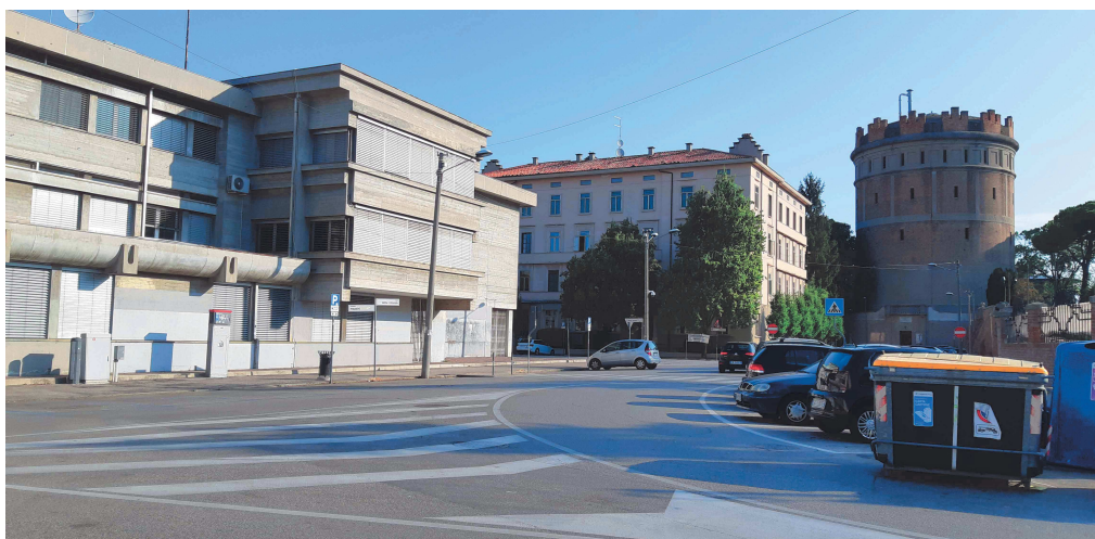
Intersezione Piazzale Mazzini con Viale della Rotonda – vista da Piazzale Mazzini