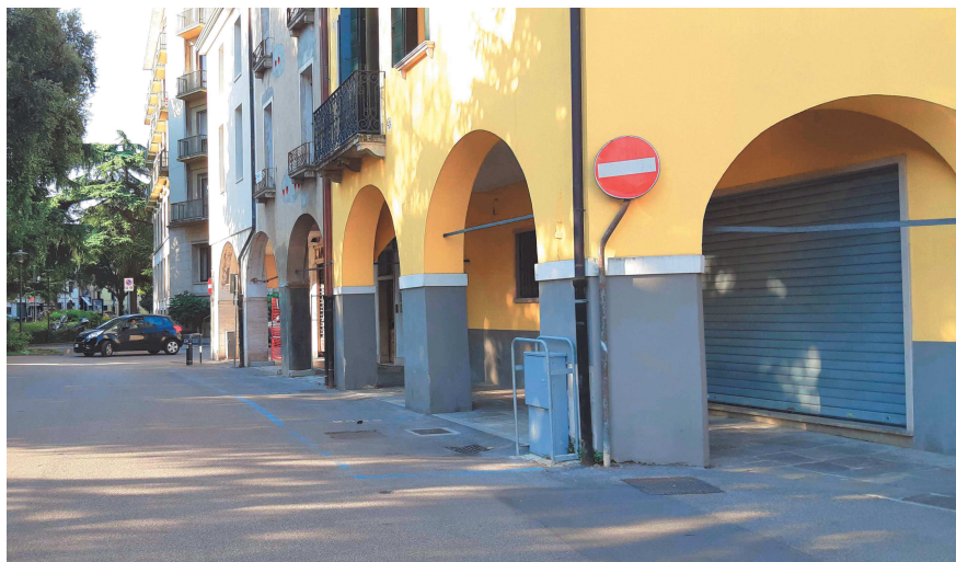
Piazzale Mazzini all'imbocco di via Della Vedova