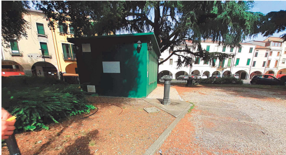
Giardini di Piazzale Mazzini – chiosco gelataio