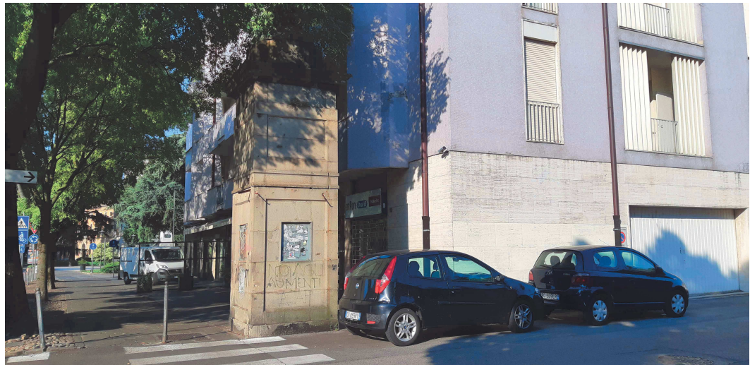
Garitta est della demolita Porta Codalunga