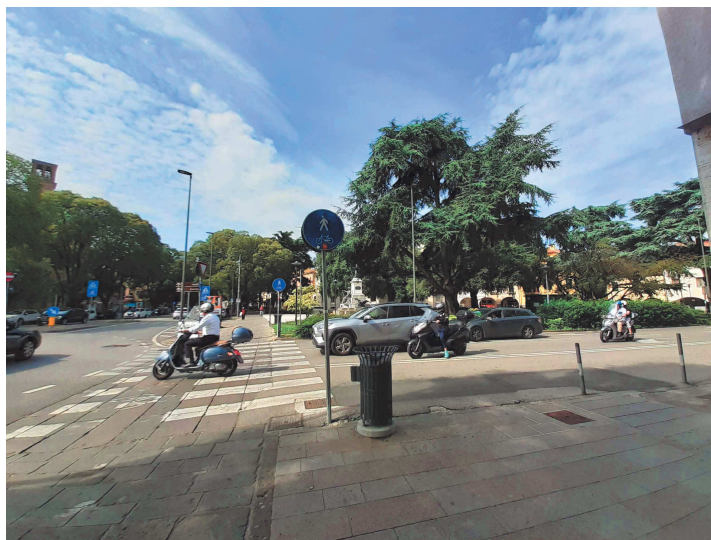
Piazzale Mazzini – tratto in prosecuzione di Viale Codalunga- vista da marciapiede lato rotatoria con via Giotto

Il tratto di Piazzale Mazzini prosecuzione di Viale Codalunga non è direttamente interessato dai lavori in progetto, ma costeggia, lungo il suo lato est, i giardini di Piazzale Mazzini all'interno dei quali si trova il monumento mazziniano.