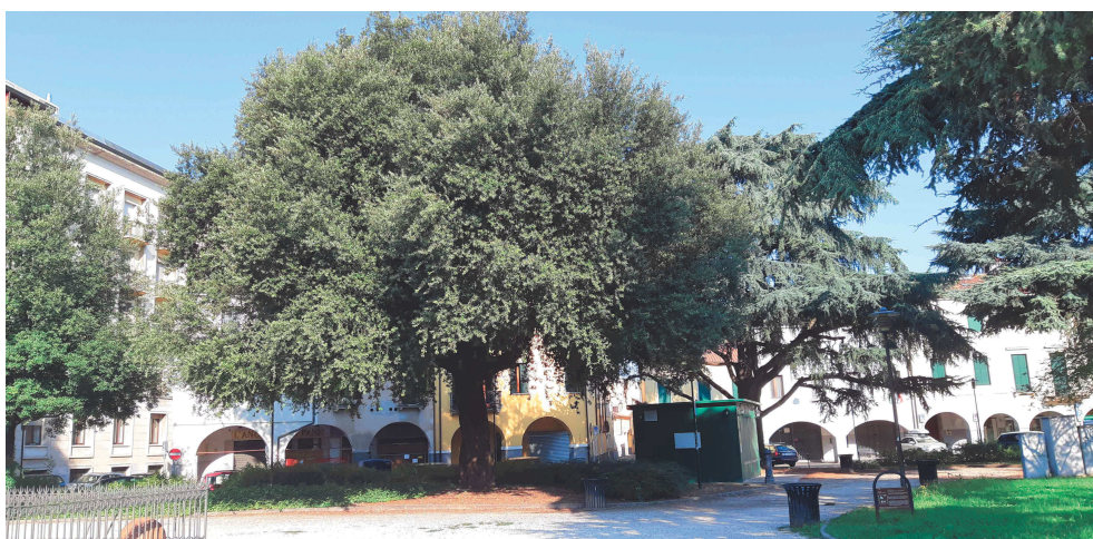
Giardini di Piazzale Mazzini – percorsi retro monumento