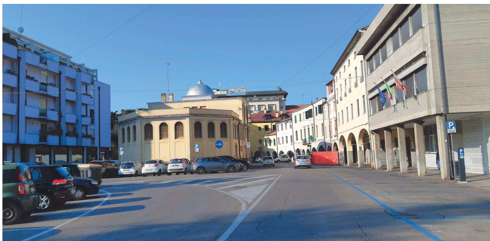
Intersezione Piazzale Mazzini con Viale della Rotonda – vista da Viale della Rotonda

L'intersezione di Piazzale Mazzini con Viale della Rotonda, retro Casa del Mutilato, si presenta come un ampio spazio diviso in corsie da apposita segnaletica orizzontale.