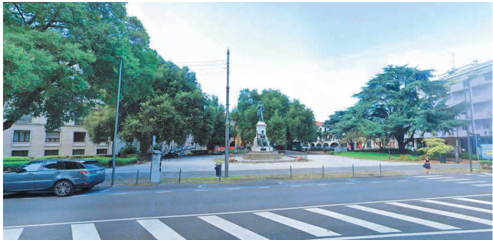
Piazzale Mazzini – tratto in prosecuzione di Viale Codalunga – a lato giardini