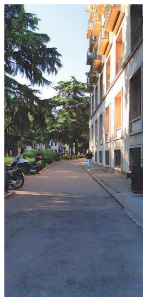
Piazzale Mazzini – tratto in prosecuzione di Viale Codalunga- vista da marciapiede lato rotatoria con via Giotto