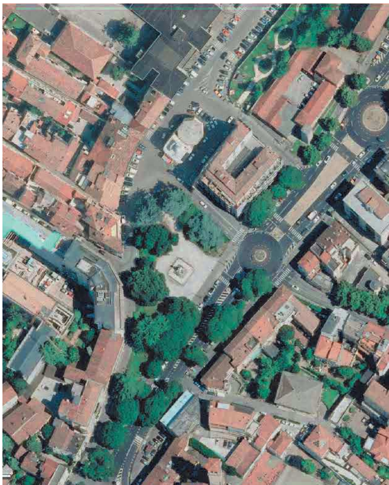
Vista dall'alto dell'area d'intervento

Il progetto, in particolare, riguarda l'incrocio tra Viale della Rotonda e Piazzale Mazzini e i seguenti tratti dello stesso Piazzale Mazzini: tratto di direzione nord-ovest/sud-est posto a nord della Casa del Mutilato (di seguito tratto nord), quelli ai fianchi di detto edificio (rispettivamente tratto lato est tra civici 28-37 e tratto lato ovest tra 41-44), tratto che dal fronte della Casa del Mutilato prosegue fino alla rotatoria con via Giotto (civici 40 e 45-47) nonché la porzione di Piazzale Mazzini posta a est dei giardini pubblici (civici 10-28). Il progetto non riguarda, invece, la parte della via ad ovest dei giardini, ossia il tratto di strada in prosecuzione di via Codalunga né quella posta a sud.