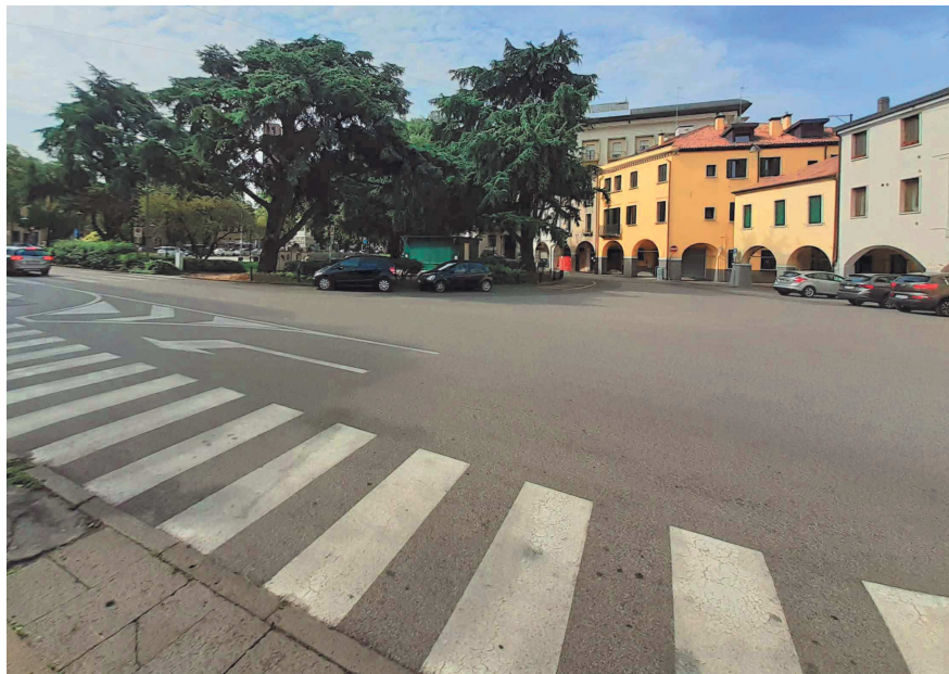
Piazzale Mazzini – tratto da fronte Case del Mutilato verso via Dalla Vedova e Vendramini

Il tratto di piazzale Mazzini, proseguendo dalla strada lato est della Casa del Mutilato e superato il piazzale di fronte a tale edificio, è a doppio senso di circolazione fino all'imbocco di via Della Vedova (strada a senso unico), superato il quale è possibile solo l'uscita da via Vendramini; dopo l'ingresso del pensionato Piaggi, infatti, alcuni paletti e due parcheggi per disabili non consentono di proseguire e la strada rimane percorribile in verso opposto.