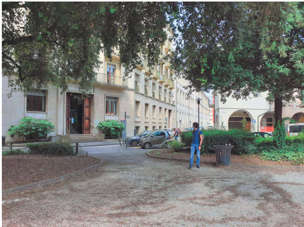
Giardini di Piazzale Mazzini – percorsi retro monumento verso entrata pensionato Piaggi