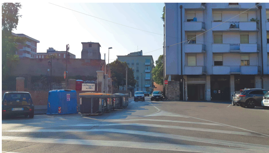
Piazzale Mazzini – tratto nord – vista dalla rotonda Piazzale Mazzini con via Giotto