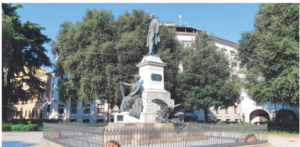
Giardini di Piazzale Mazzini – monumento del Mazzini