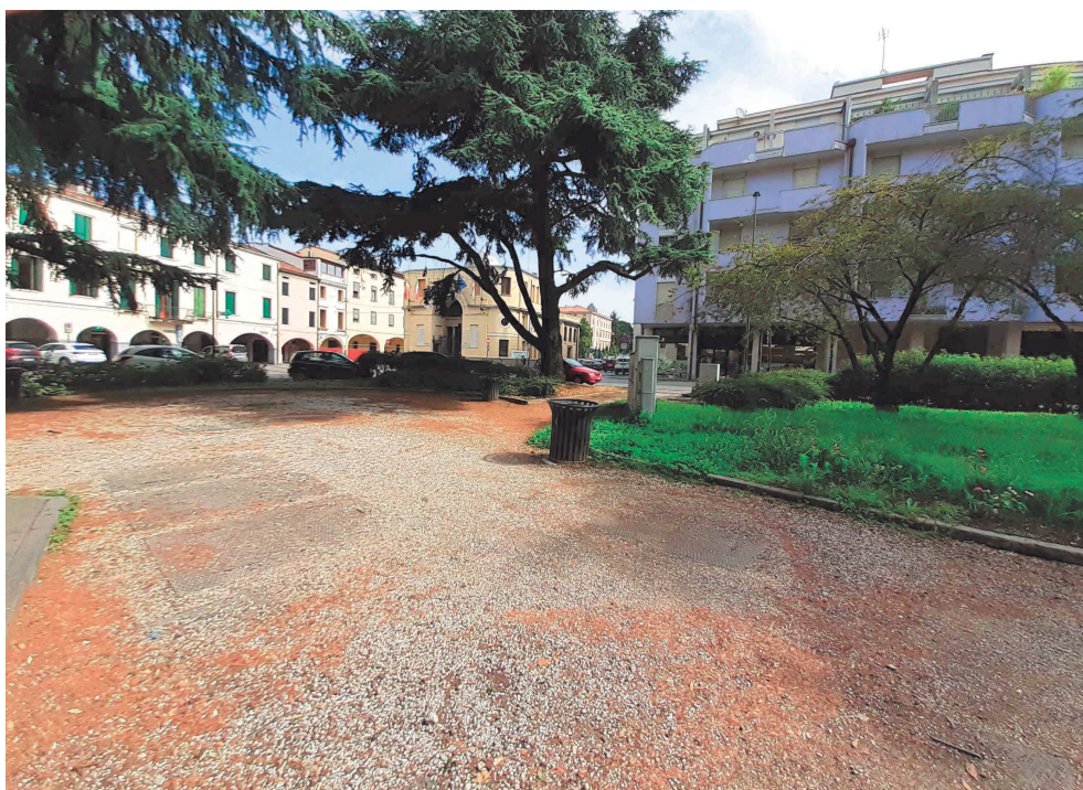
Giardini di Piazzale Mazzini – percorso verso Casa del Mutilato