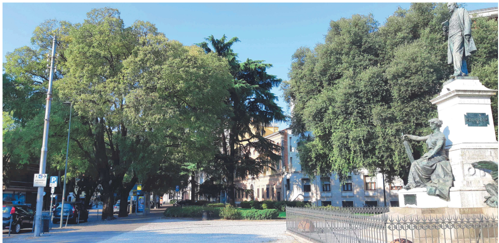
Giardini di Piazzale Mazzini – percorsi verso sud