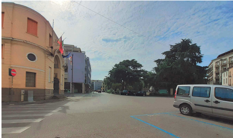
Piazzale Mazzini – tratto da fronte Casa del Mutilato a rotatoria con via Giotto – vista da fronte Casa del Mutilato

Il tratto di Piazzale Mazzini che dallo spiazzo davanti alla Casa del Mutilato prosegue verso la rotatoria con via Giotto, è a doppio senso di circolazione con due corsie per il senso di marcia verso detta rotatoria e una sola in direzione contraria; si tratta di strada priva di aree per la sosta e dotata, solo sul lato nord ossia su quello opposto ai giardini pubblici, di marciapiede caratterizzato dalla presenza di bocche di lupo dell'edificio prospiciente.