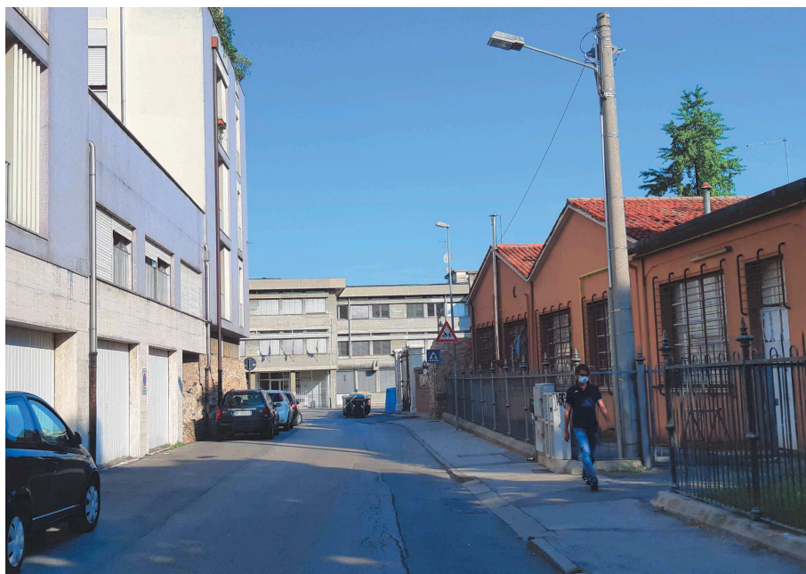
Piazzale Mazzini – tratto nord – vista dalla rotonda intersezione Piazzale Mazzini con via Giotto

All'imboccatura del tratto proveniente dalla rotonda posta all'intersezione di Piazzale Mazzini con via Giotto si trova la garitta est della demolita Porta Codalunga