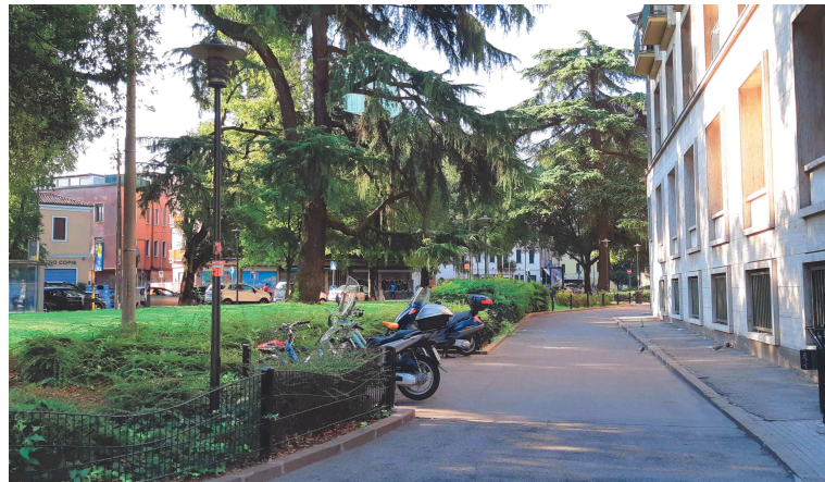
Piazzale Mazzini dopo imbocco via Vendramini