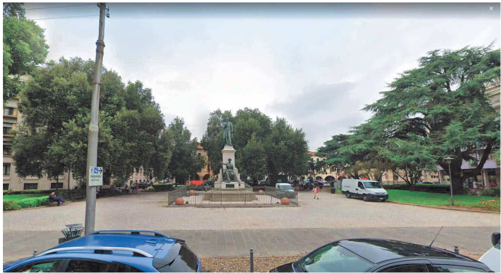
Giardini con il monumento dedicato a Giuseppe Mazzini

Si riportano di seguito alcune immagini dei giardini di Piazzale Mazzini all'interno dei quali si trova il monumento di Giuseppe Mazzini.