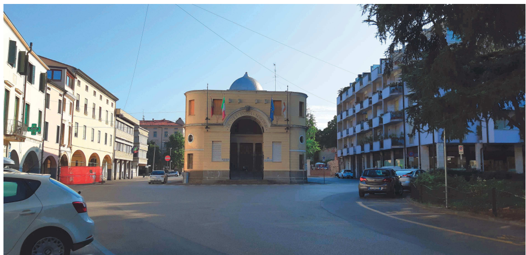
Slargo fronte Casa del Mutilato

Di fronte alla Casa del Mutilato si ha un allargamento della strada che non riesce tuttavia a valorizzarne la facciata ma finisce per isolare l'edificio confinandolo all'interno di uno spazio con funzione di rotatoria per il traffico.