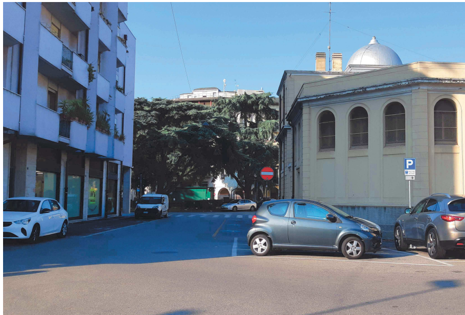
Piazzale Mazzini – tratto lato ovest della Casa del Mutilato - vista da Viale della Rotonda

Anche la porzioni di Piazzale Mazzini che costeggia il lato ovest della Casa del Mutilato è a senso unico ad un'unica corsia con spazi per la sosta su ambo i lati.