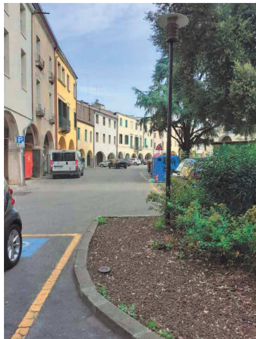
Piazzale Mazzini vista da ingresso pensionato Piaggi