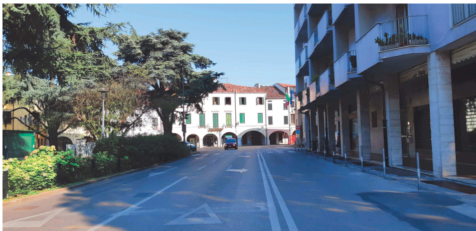
Piazzale Mazzini – tratto da fronte Casa del Mutilato a rotatoria con via Giotto – vista da rotatoria con via Giotto