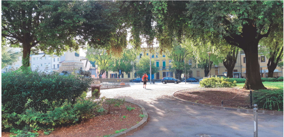
Giardini di Piazzale Mazzini – percorsi visti da entrata pensionato Piaggi