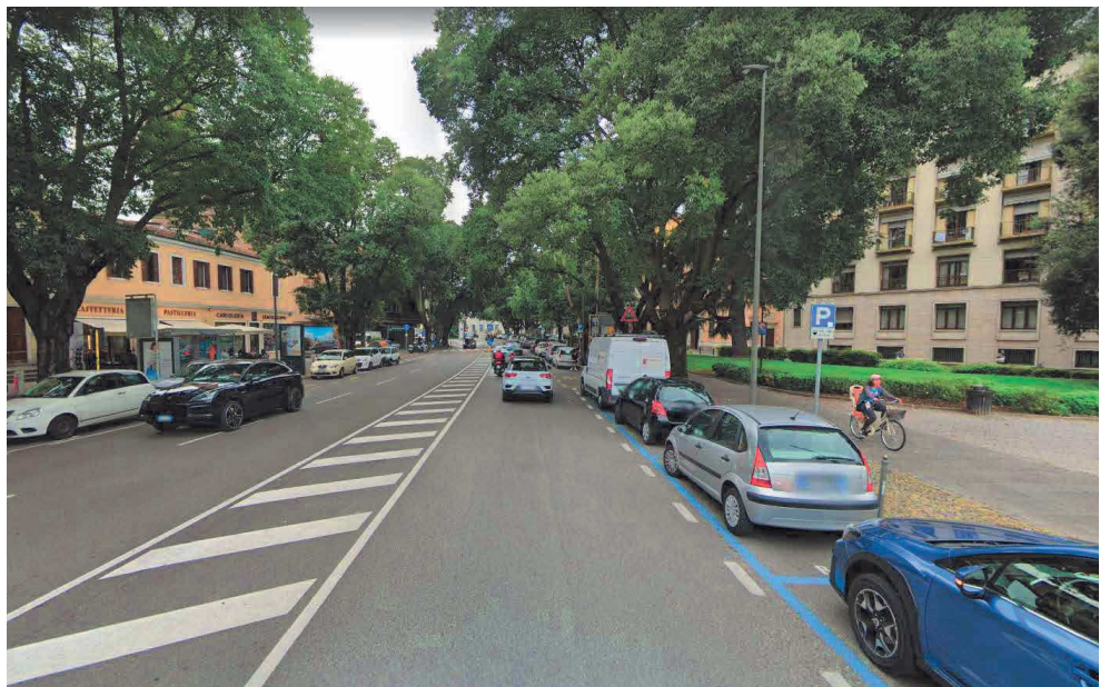
Piazzale Mazzini – tratto in prosecuzione di Viale Codalunga