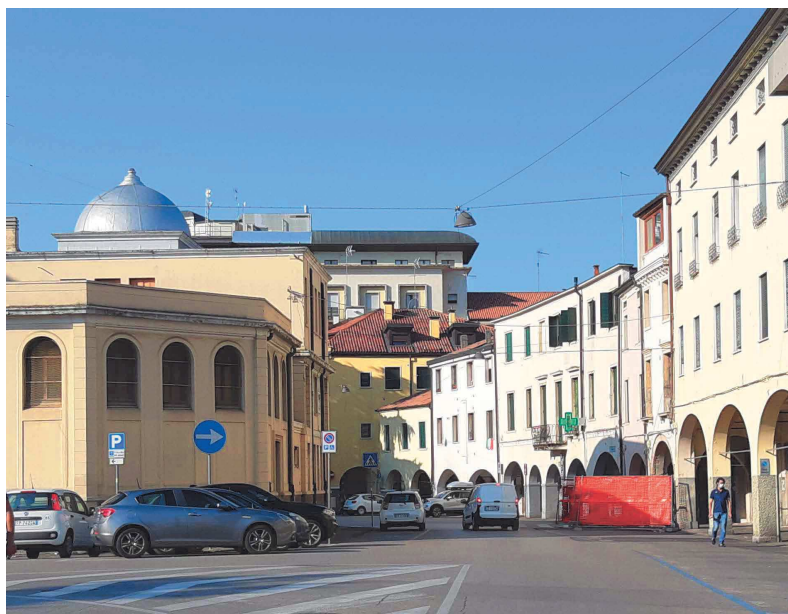
Piazzale Mazzini – tratto lato est della Casa del Mutilato – vista da Viale della Rotonda

La porzione di Piazzale Mazzini che costeggia il lato est della Casa del Mutilato è a senso unico ad un'unica corsia con spazi per la sosta su ambo i lati.