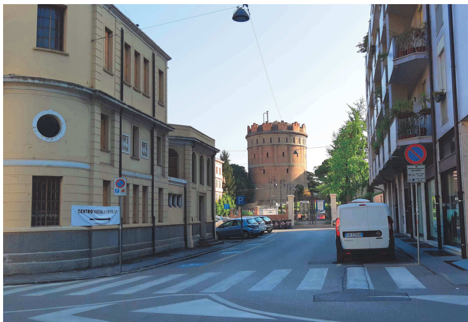
Piazzale Mazzini – tratto lato ovest della Casa del Mutilato - vista da fronte Casa del Mutilato