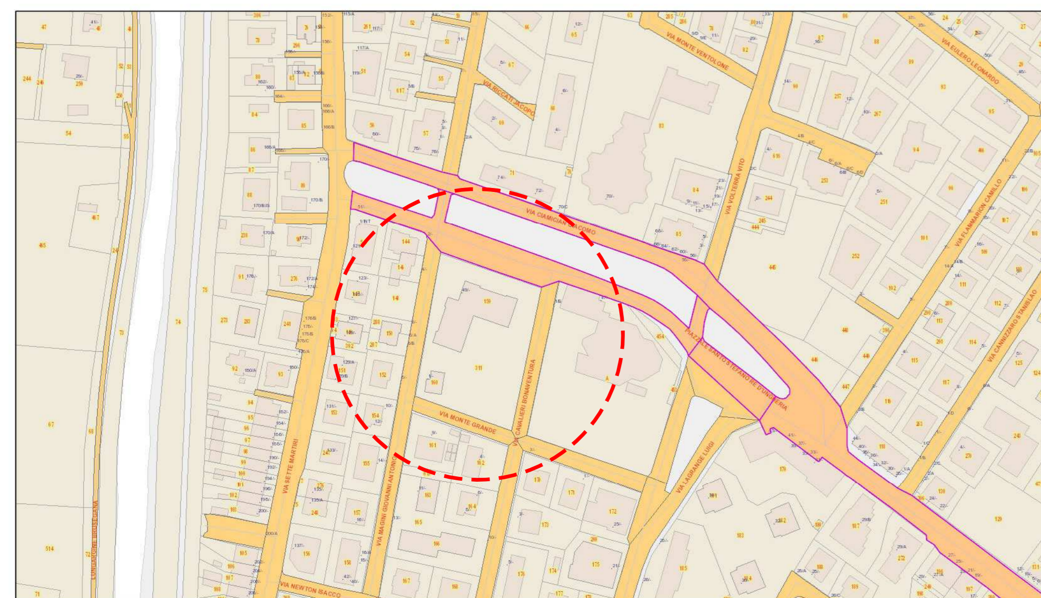
ESTRATTO MAPPA CATASTALE