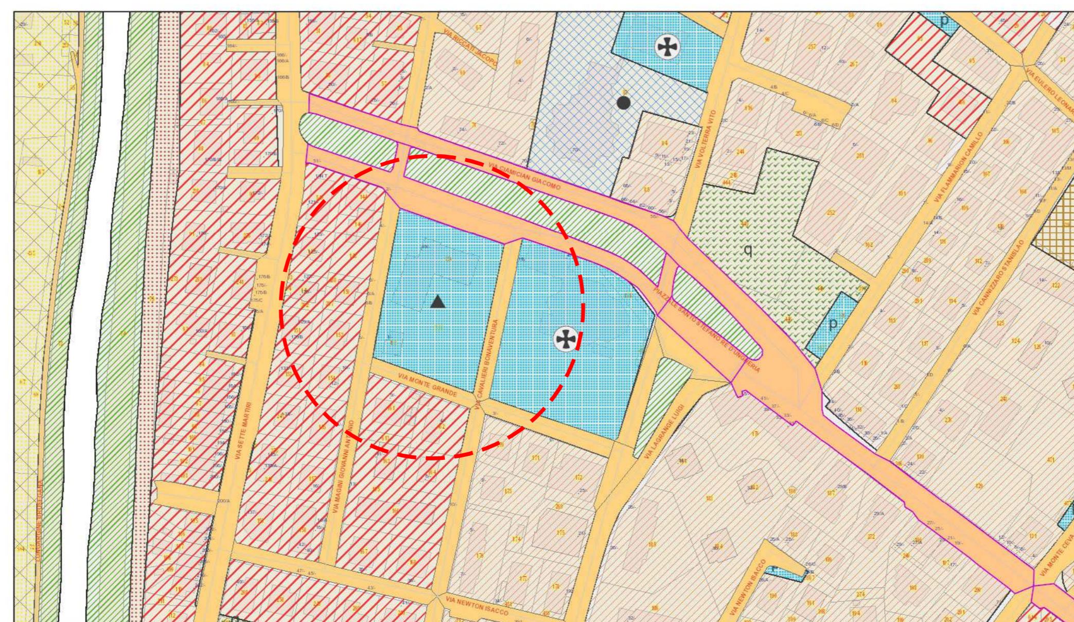
ESTRATTO DI P.R.G.