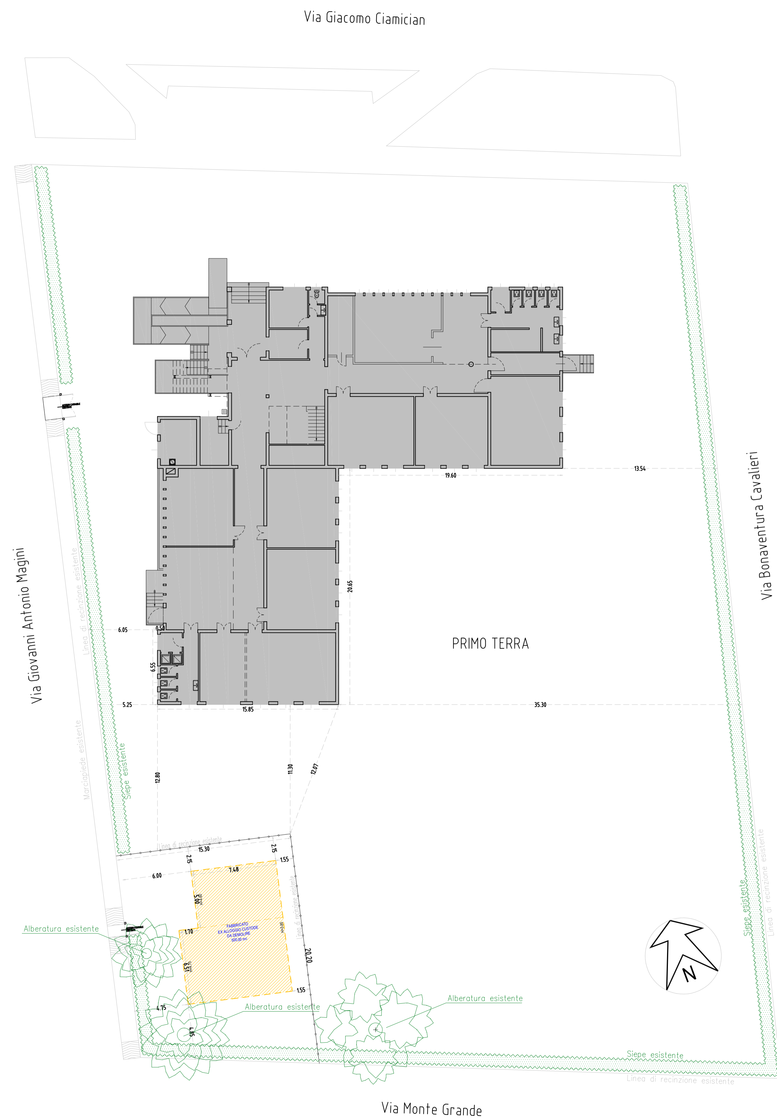
PLANIMETRIA GENERALE Stato di FATTO Scala 1:200