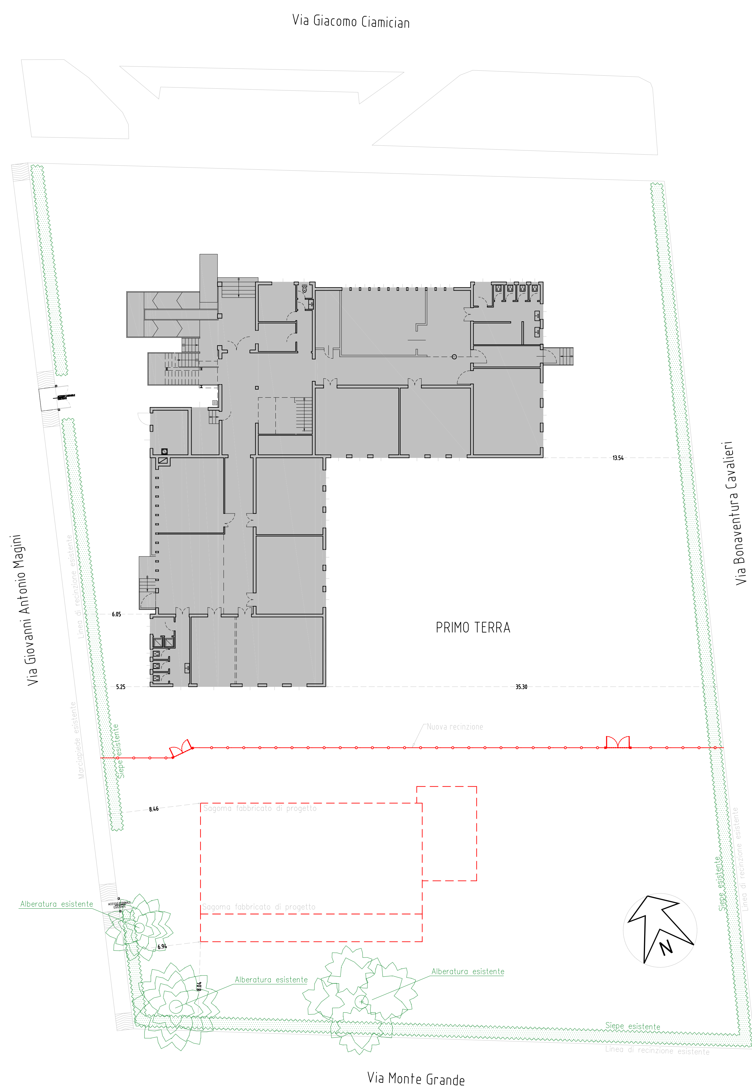
PLANIMETRIA GENERALE Stato di PROGETTO Scala 1:200