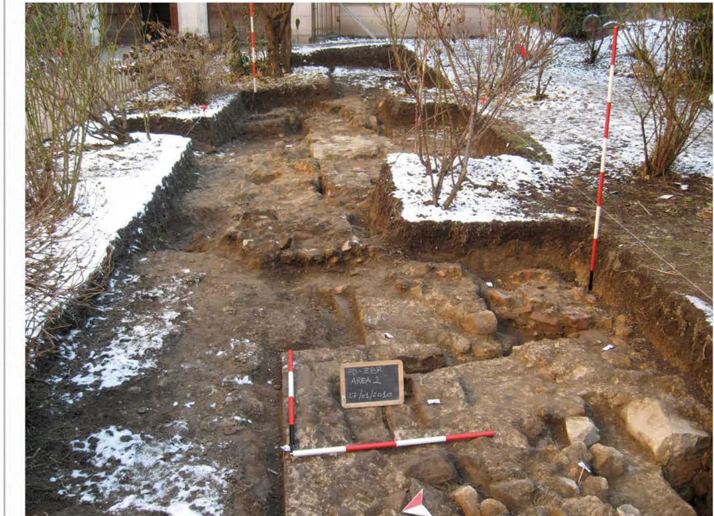
TAVOLA: 2 OGGETTO: APPROFONDIMENTO SONDAGGI ARCHEOLOGICI VIA DEGLI ZABARELLA N. 54 - PADOVA

Beni Stabili Spa Sede legale: Via Piemonte ,38 - 00187 Roma tel. +39.06.36222.1 - 06.36222.745