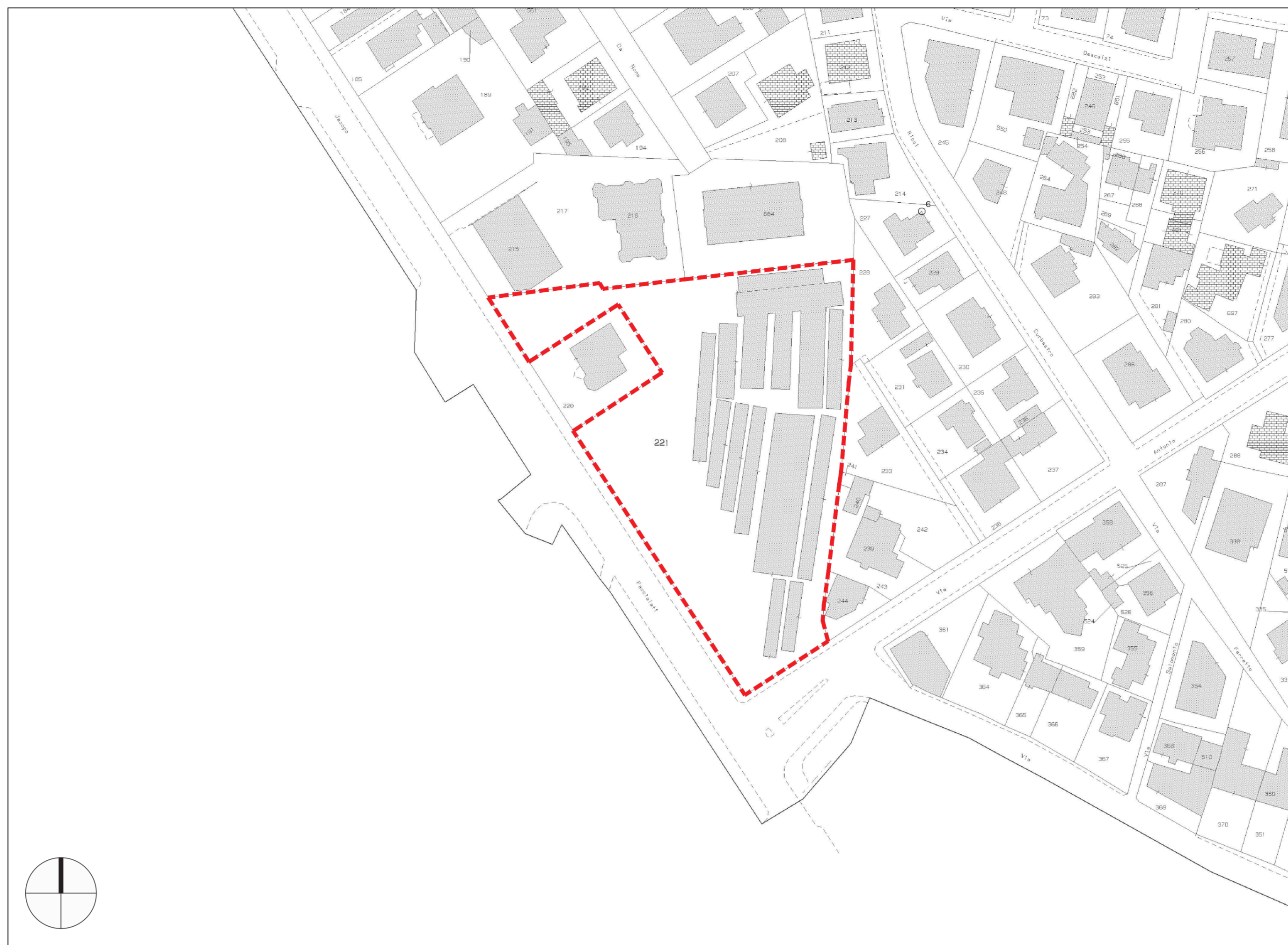
ESTRATTO N.C.T. FG. 141 MAPP. 221 SCALA 1:1000