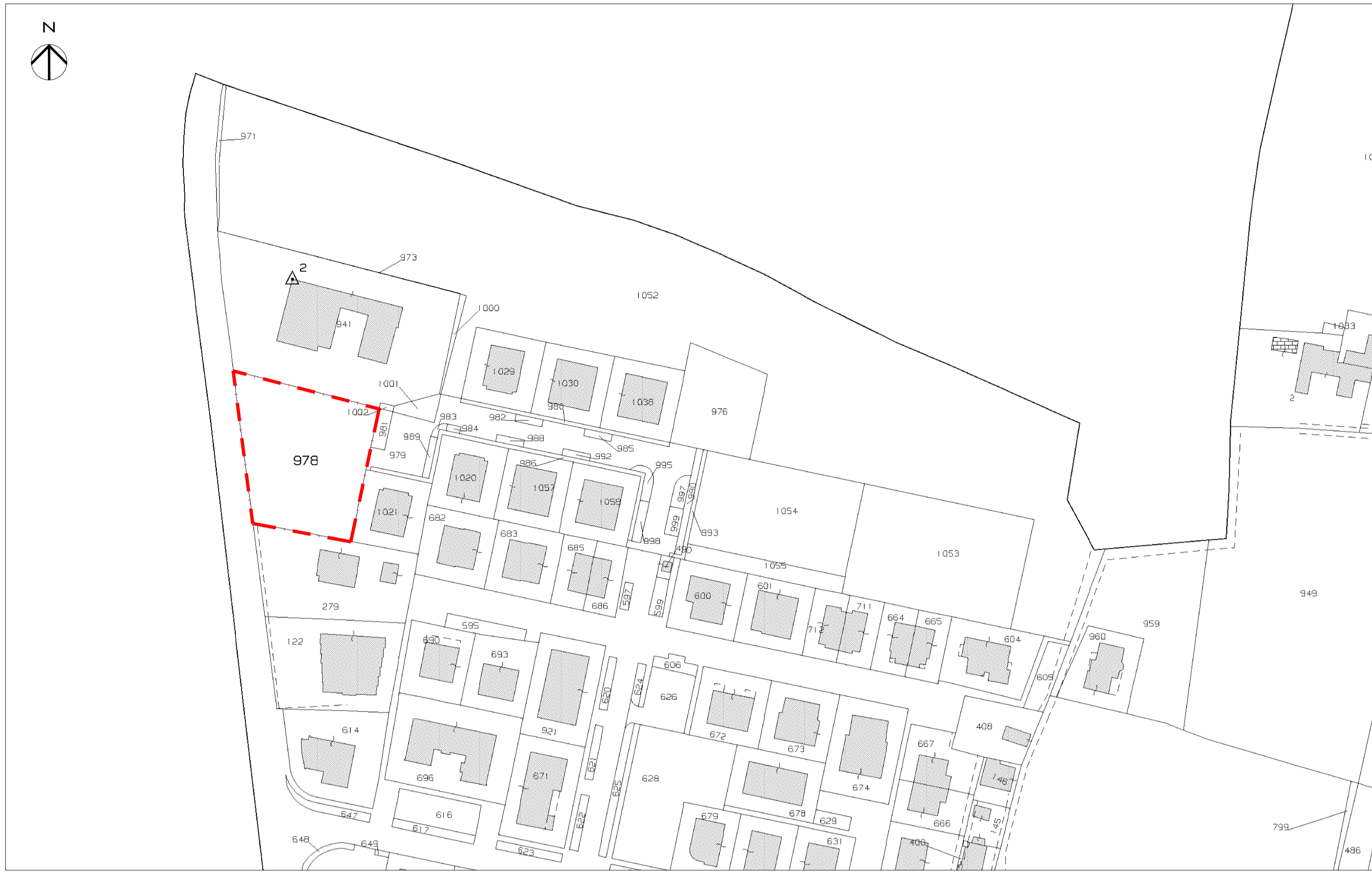
ESTRATTO DI MAPPA CATASTALE - N.C.T. FOGLIO 112 MAPPALE 978