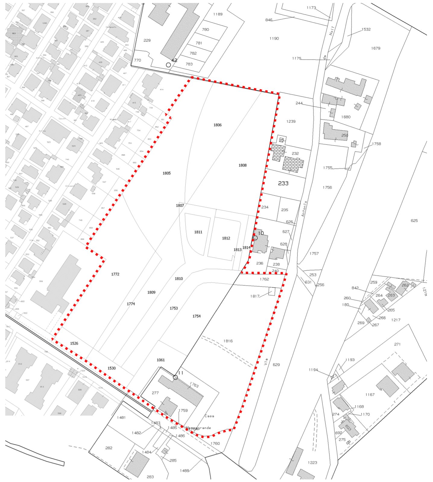
ESTRATTO DI MAPPA CATASTALE - FOGLIO 36