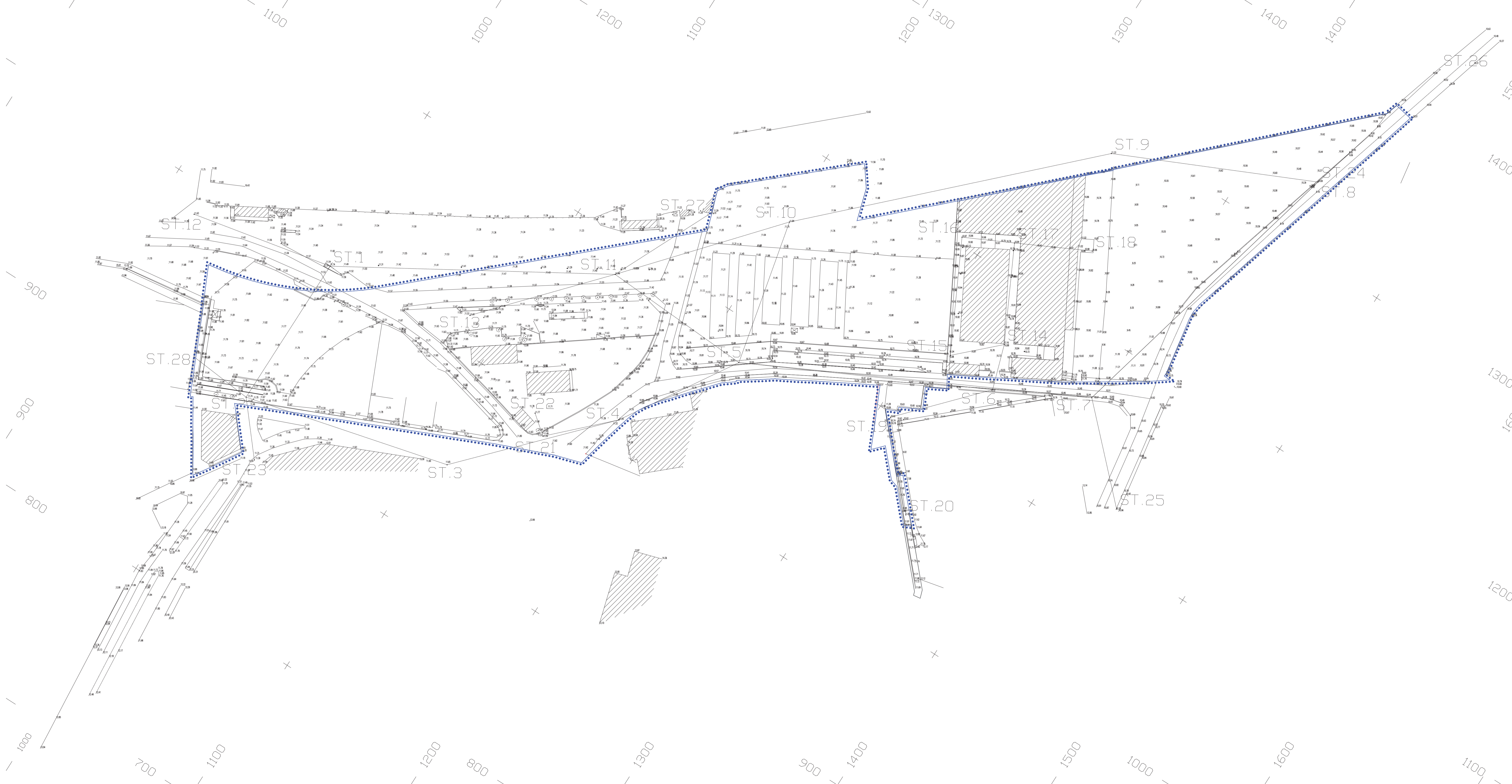
RILIEVO TOPOGRAFICO - scala 1:1000