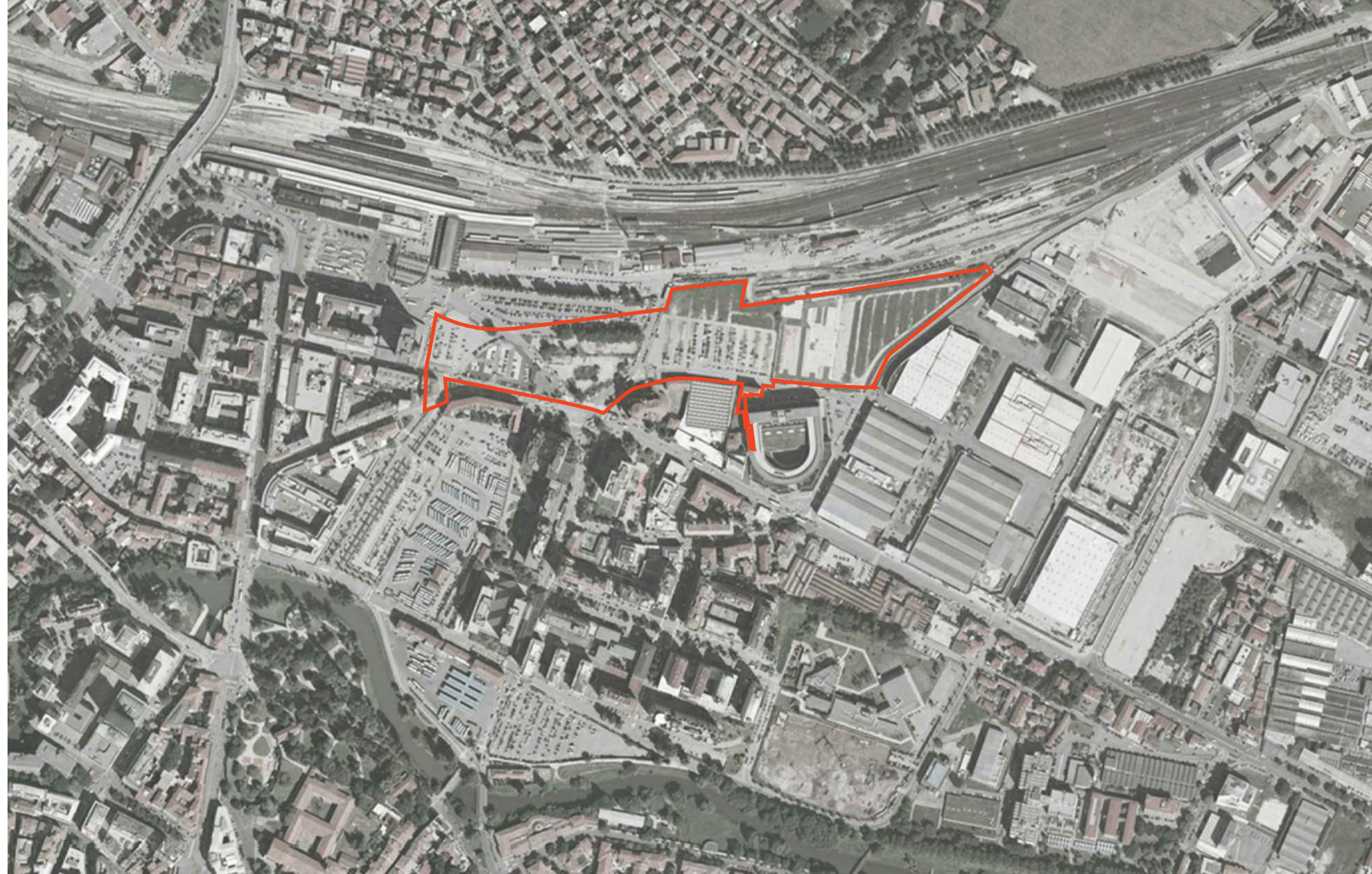
FOTOGRAFICO - scala 1:5000