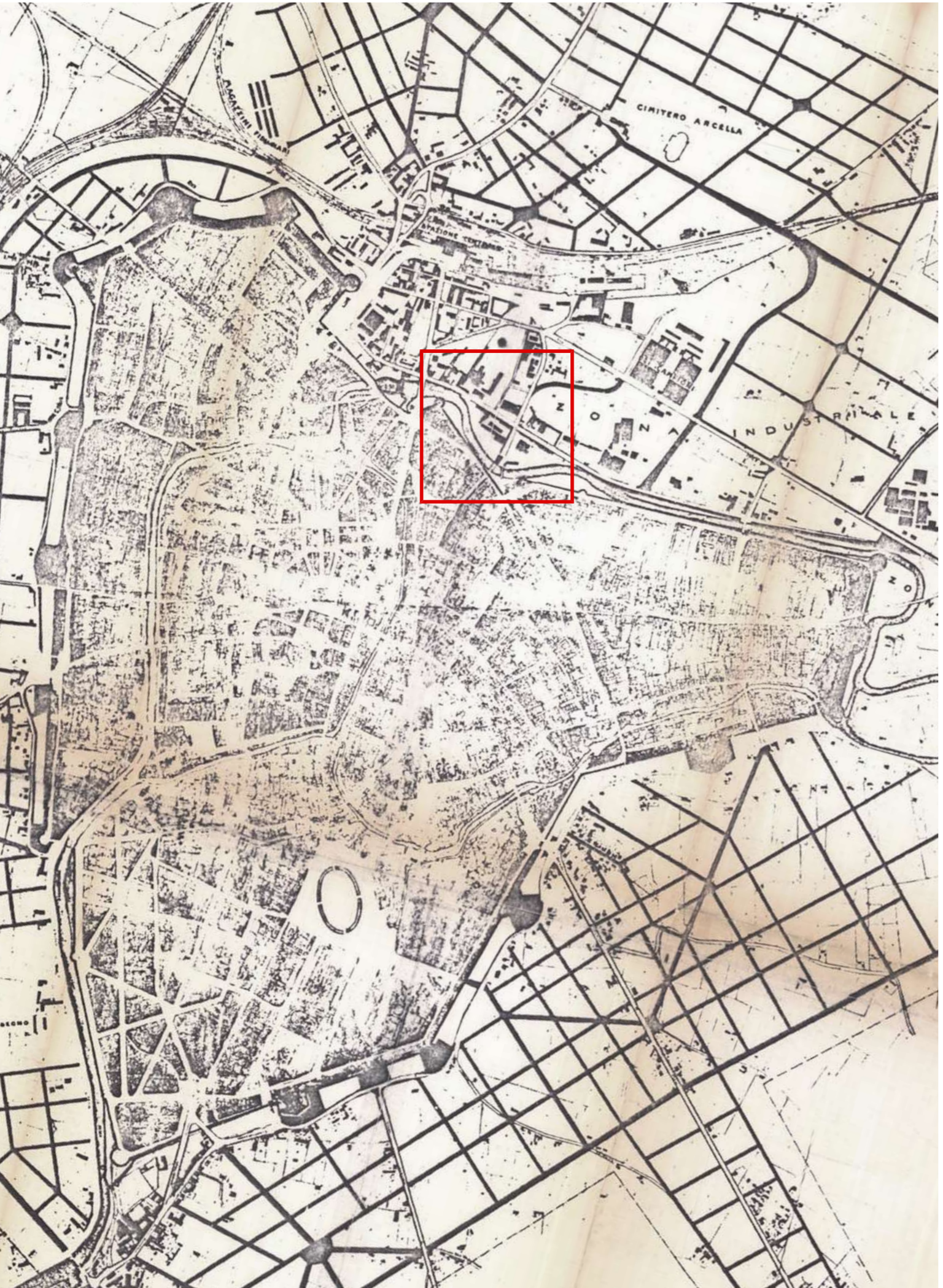
PIANO REGOLATORE DI AMPLIAMENTO | 1923