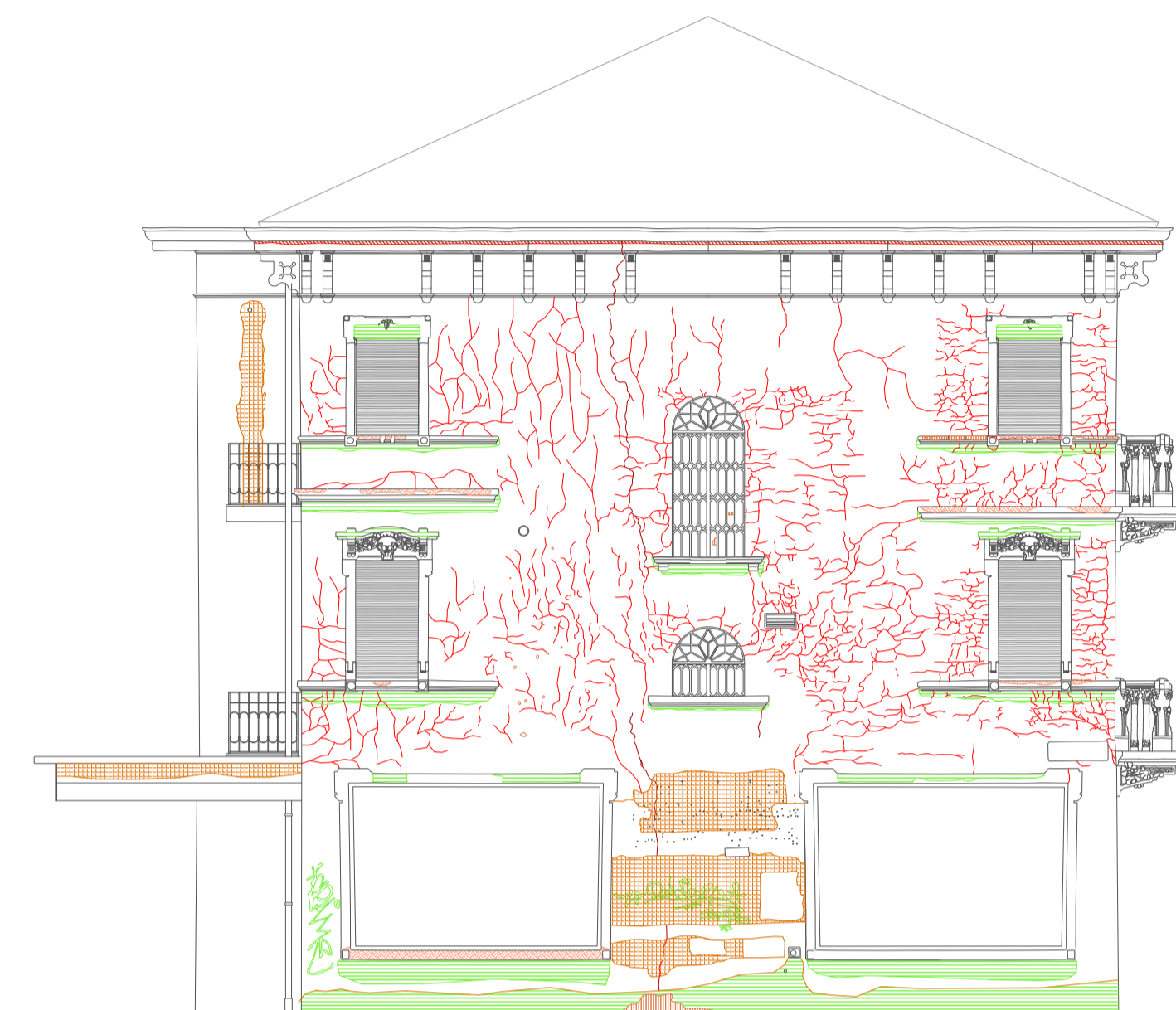
Prospetto Est Palazzina Est SDF