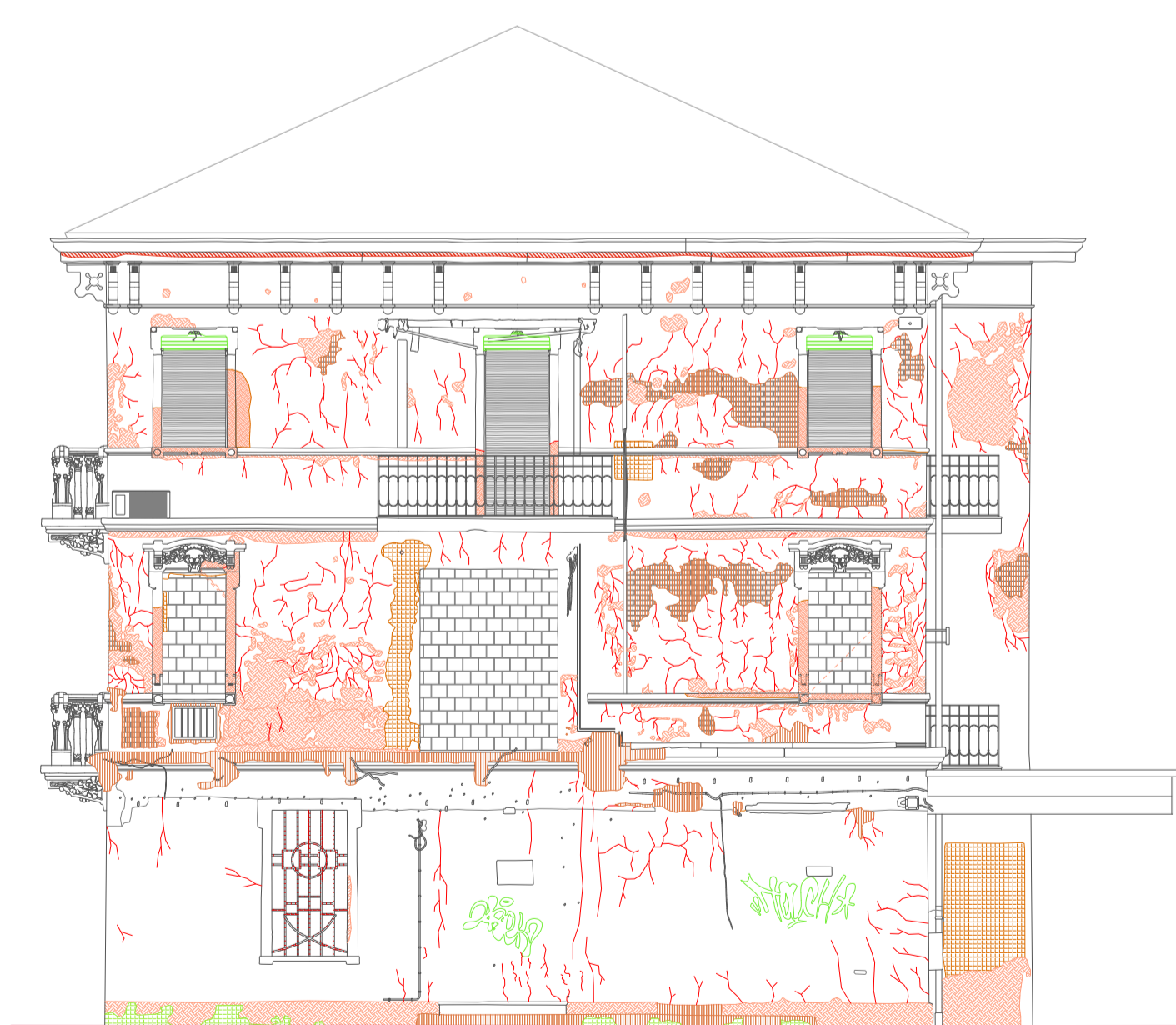
Prospetto Ovest Palazzina Est SDF