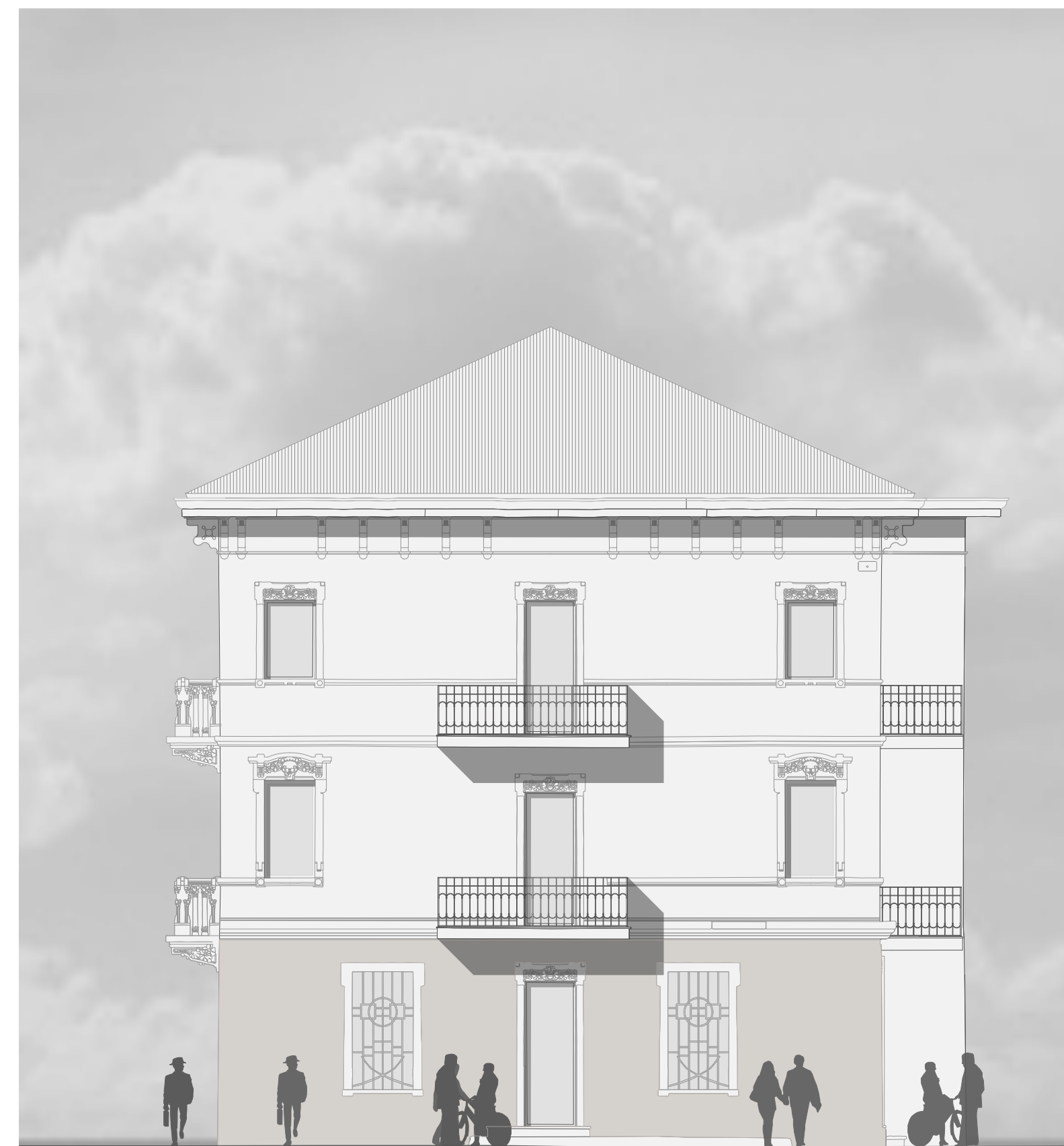
Prospetto Ovest Palazzina Est PROGETTO 1:200