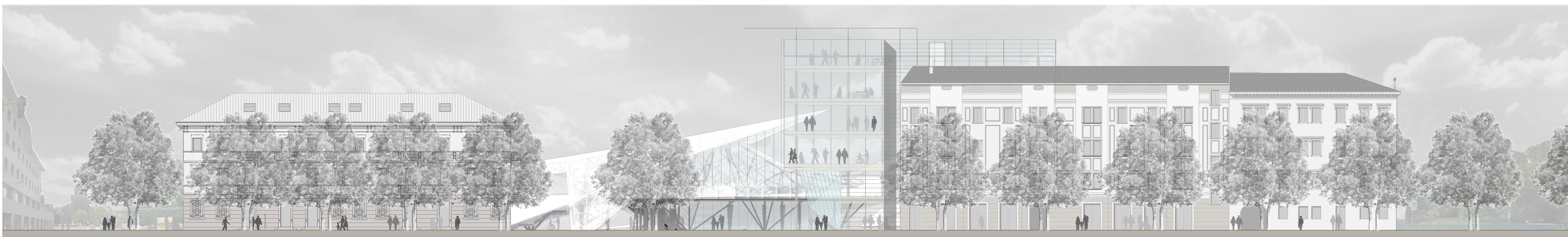
PROSPETTO NORD - Scala 1:200