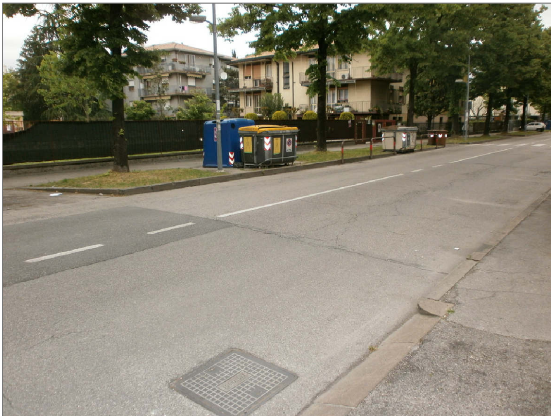
PUNTO DI RIPRESA 03