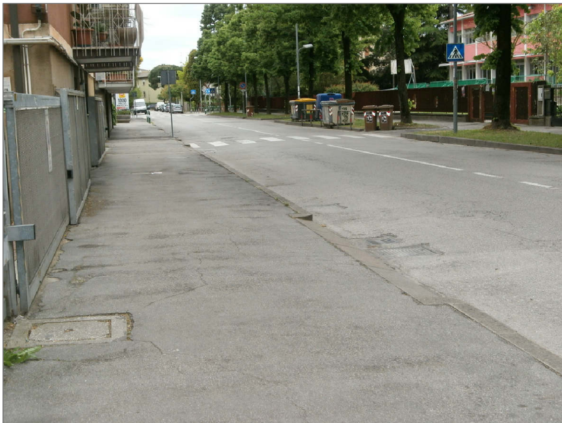
PUNTO DI RIPRESA 01