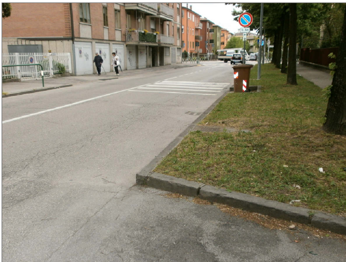
PUNTO DI RIPRESA 02