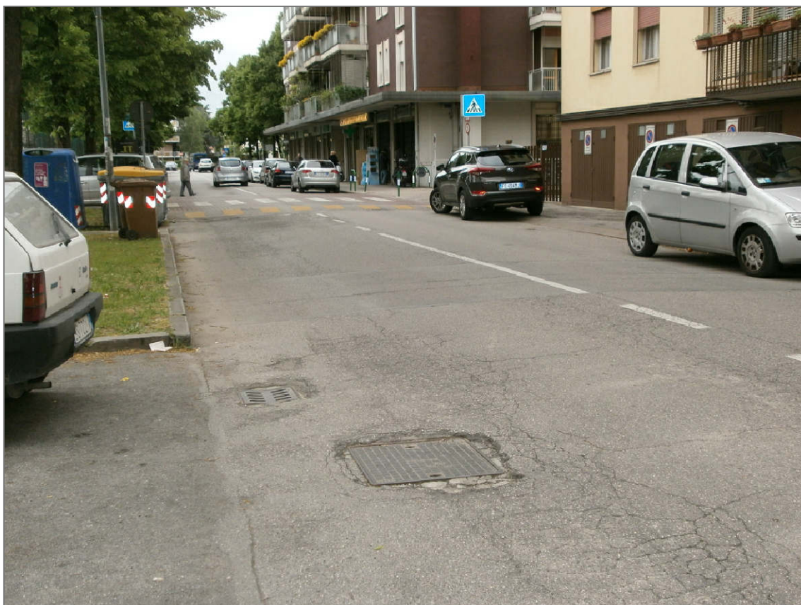
PUNTO DI RIPRESA 06