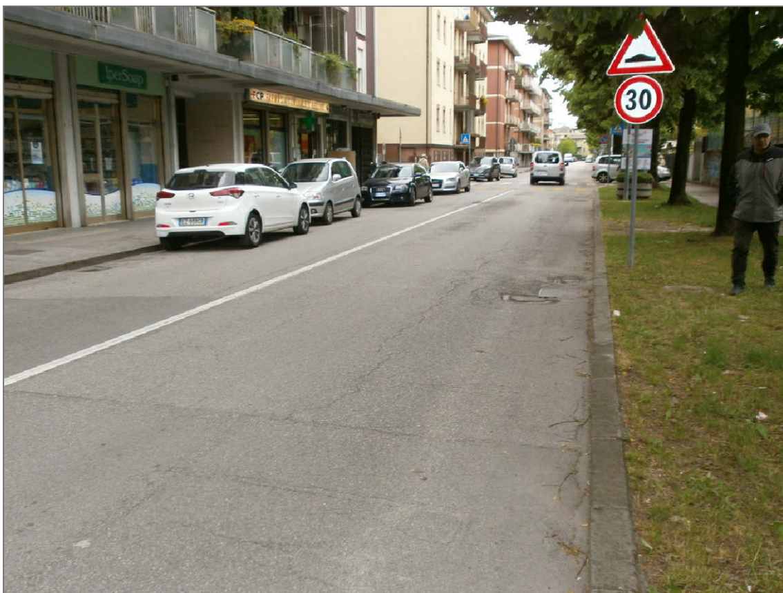
PUNTO DI RIPRESA 04