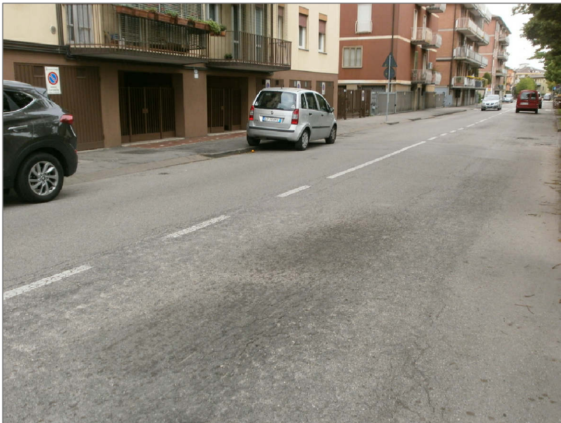
PUNTO DI RIPRESA 05