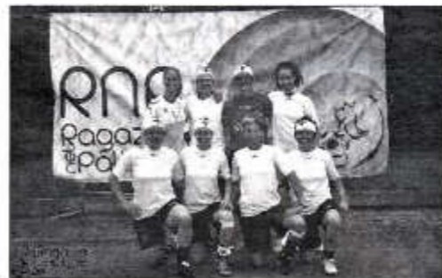
LE VINCITRICI Sono state 48 le squadre che hanno preso parte al torneo

rugby in carrozzina. Molto interessante il dibattito "Sport e Lavoro: prospettive ed opportunità del movimento al femminile". La manifestazione ha anche avuto momenti di intrattenimento musicale con gruppi tutti al femminile, come le "Ubdolls", quartetto femminile padovano che fa "countrybilly".