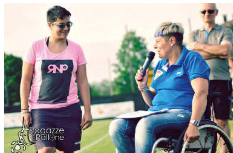
Tra gli eventi complementari, è stata importante la partecipazione di Onlus ASD calcio veneto for disable , associazione sportiva di diversabili fisici e cerebrali.