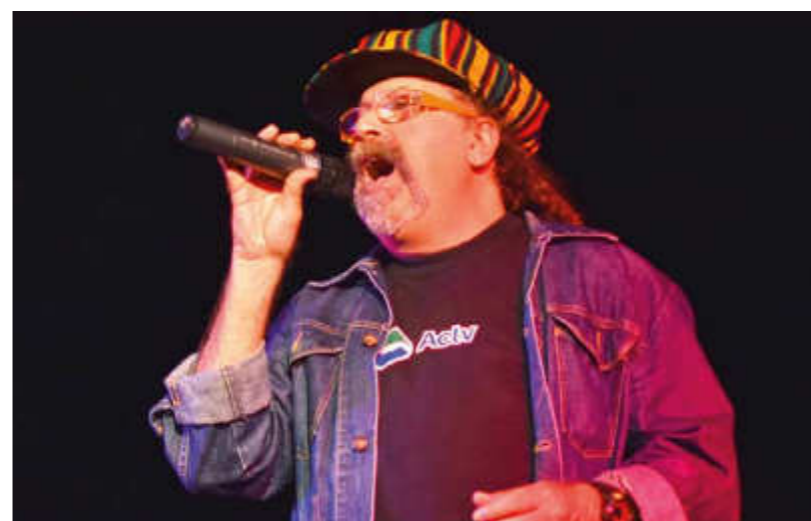
La giornata inaugurale ha visto il concerto inaugurale di Sir Oliver Skardi, ex dei Pitura Freska.