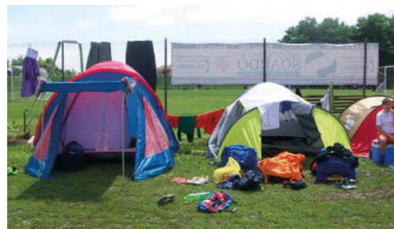
Le partecipanti hanno la possibilità di pernottare utilizzando tende ed attrezzature da campeggio presso appositi spazi vicini ai campi da gioco.