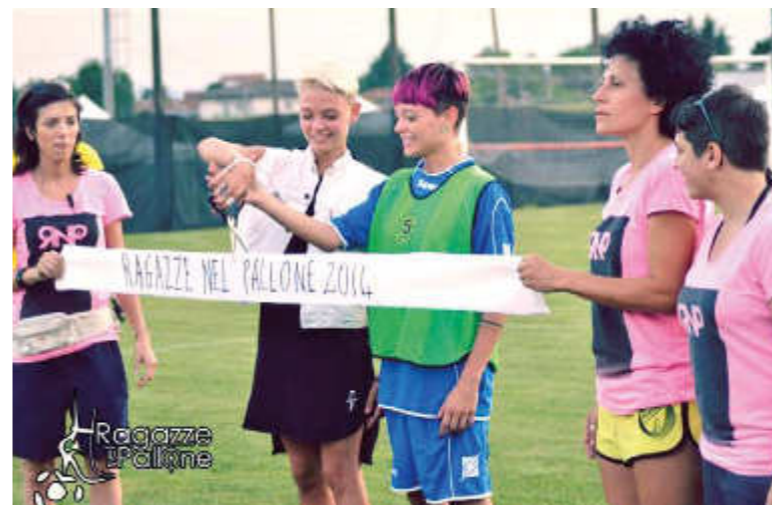
Testimonial dell'evento: "Le Donatella", il giovane duo femminile famoso per la partecipazione a X-Factor e L'Isola dei Famosi.