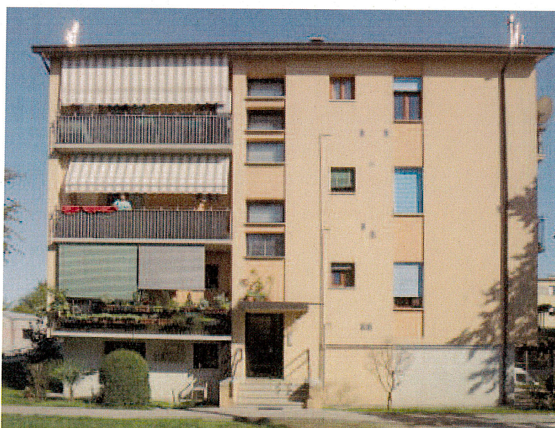
Via Malibran civ. 7