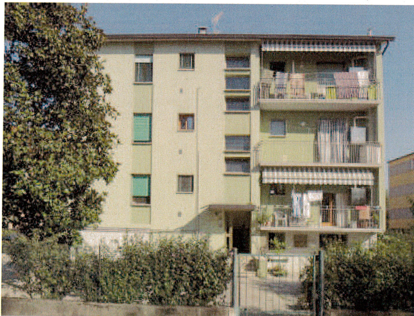
Via Ristori civ. 18