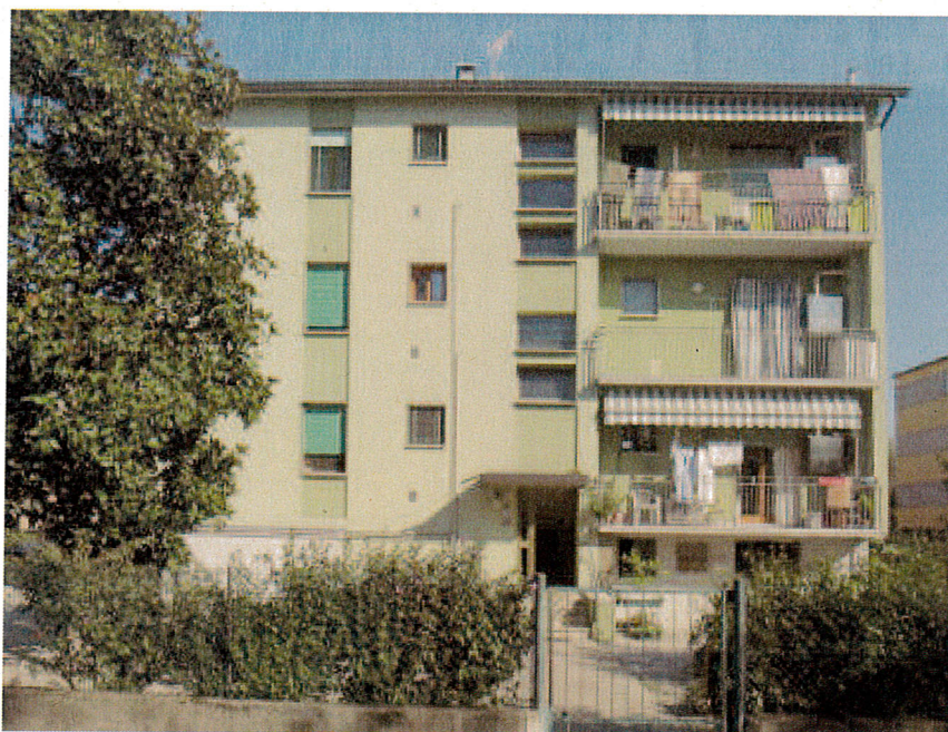
Via Malibran civ. 9