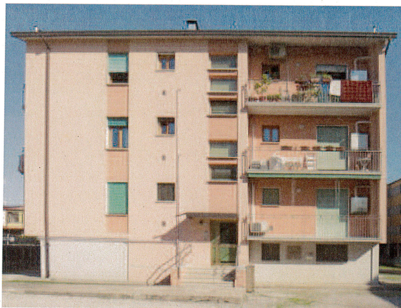
Via Malibran civ. 5