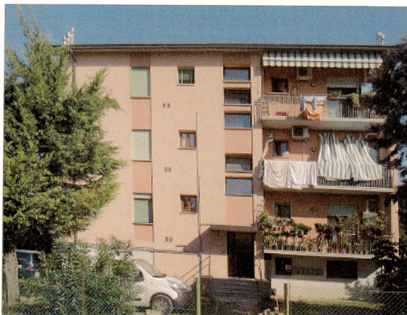
Via Malibran civ 3