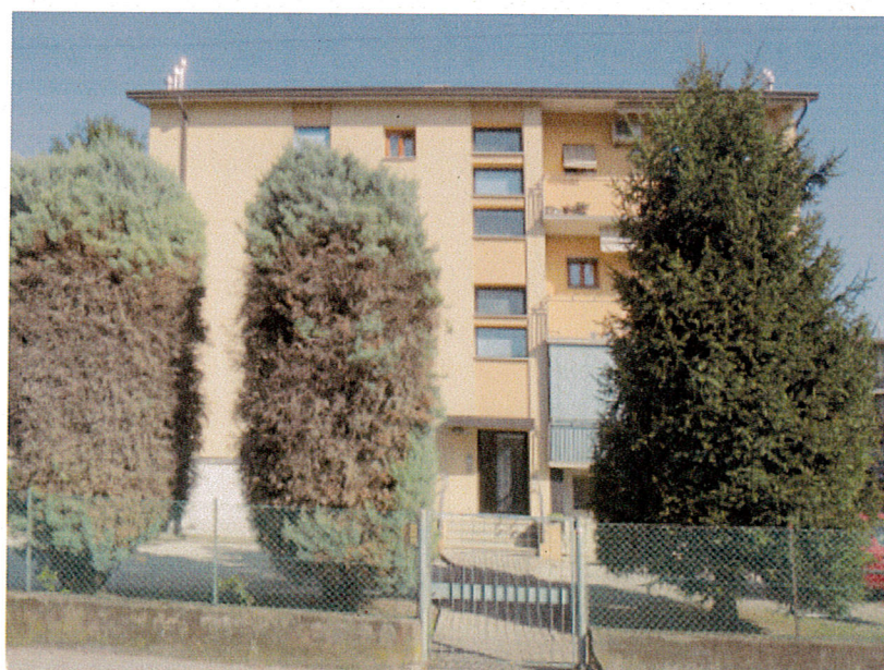
Via Malibran civ 1