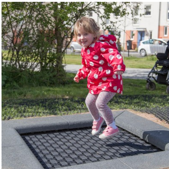
Illustrazione 7: Trampolino

Costituito da tessuto robusto in cinghie rinforzate con acciaio, resistente a vandalismo, raggi UV e condizioni meteo. Area di ingombro m 1,50x1,50. Consente di saltare, nel caso di utilizzo da utente con carrozzina permette l'oscillazione verticale