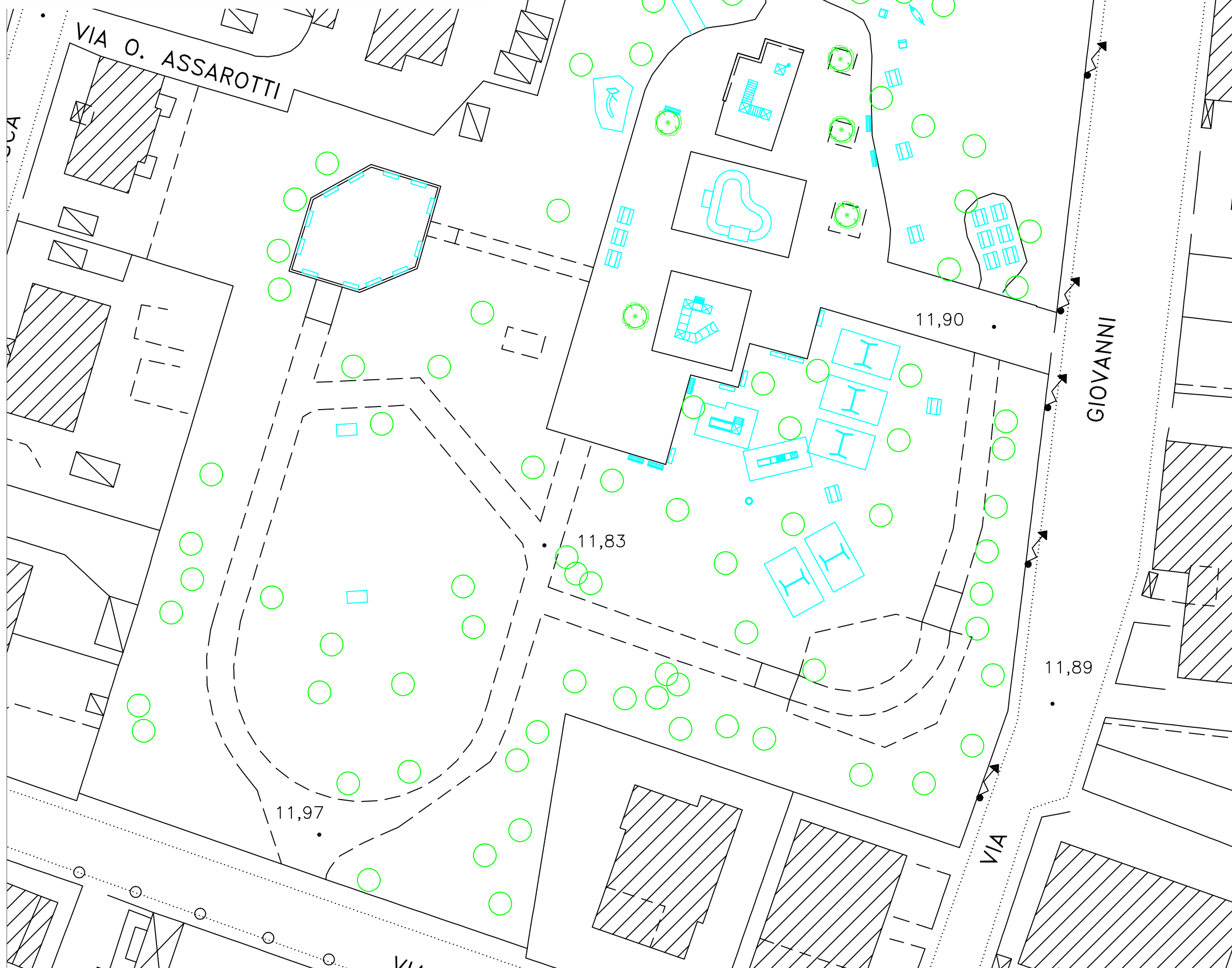
Parco San Carlo - sc. 1:500