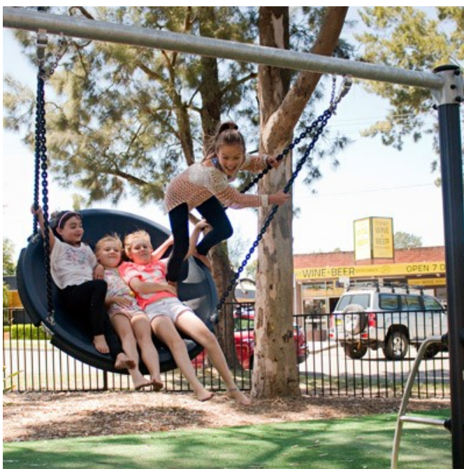
Illustrazione 5: Altolena con cestone

Costituita da due pali in acciaio galvanizzato non verniciato ed una trave orizzontale a cui sono collegate le catene in acciaio galvanizzato a piccole maglie rivestite in materiale plastico per evitare abrasioni. Il cesto è in polietilene rotostampato. Con l'aiuto di un accompagnatore può accedere anche un utente con disabilità motoria, potendo così cullarsi con l'oscillazione