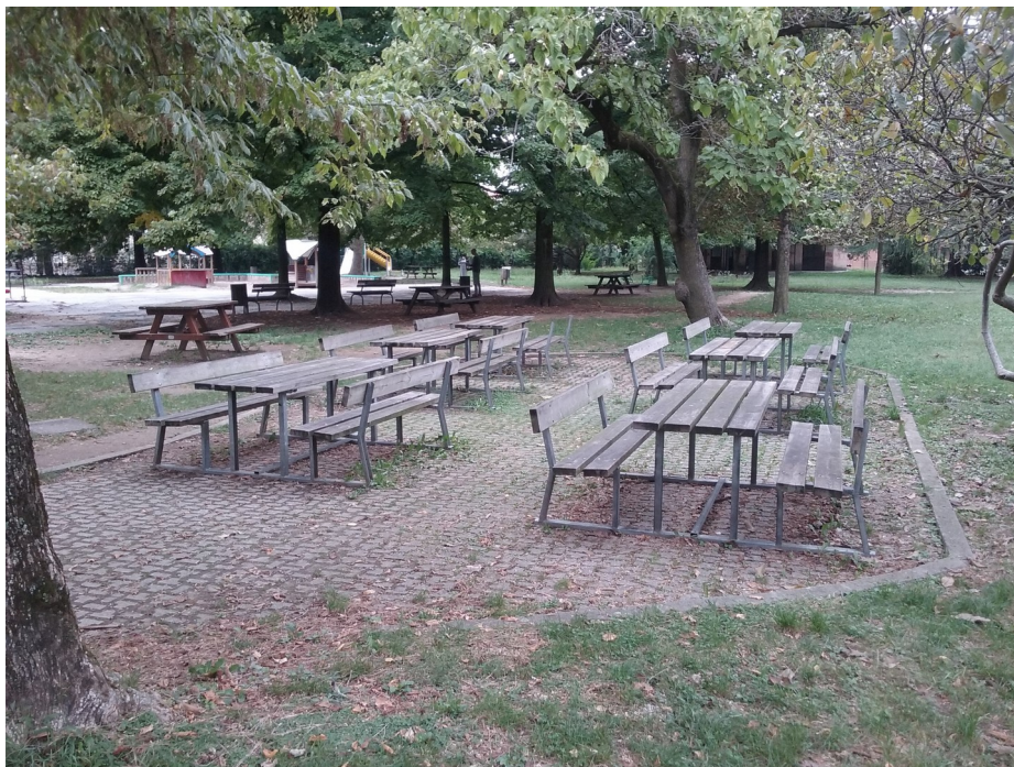
Illustrazione 3: Area di sosta con tavoli

Oltre a queste strutture ludiche, in adiacenza alla zona di ingresso al parco giochi, c'è un'area dotata di tavoli con panca che risulta gradita all'utenza anziana che frequenta il parco accompagnando i piccoli utenti.