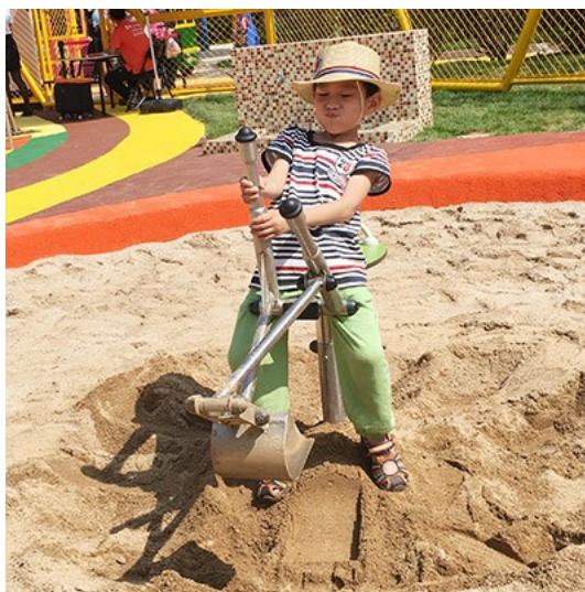
Illustrazione 8: Escavatore

Costituito da struttura in acciaio inox, pannelli colorati in HPL resistenti alle intemperie e agli atti vandalici. Consente il gioco di movimentazione e manipolazione della sabbia. Consente l'affiancamento di sedia a ruote.