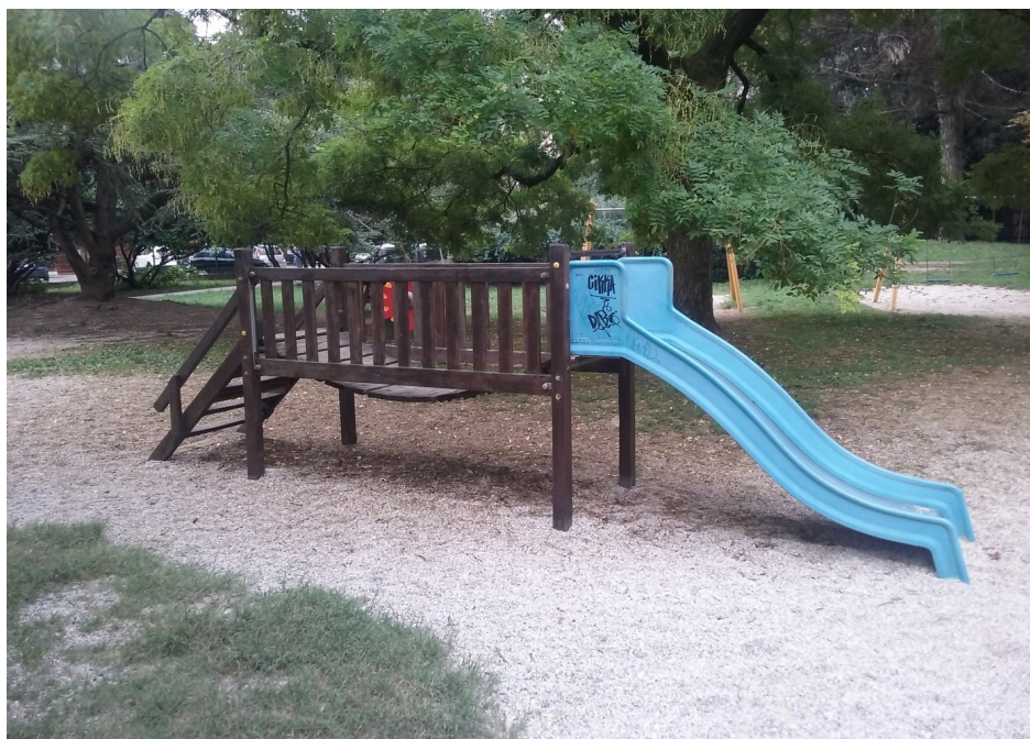
Illustrazione 1: Uno dei giochi più datati presenti nel parco

Trattandosi di attrezzature datate, spesso i criteri progettuali in base ai quali sono stati costruiti non hanno prestato attenzione a requisiti di accessibilità e di inclusione che sempre più risultano presenti nella produzione attuale di attrezzature ludiche.