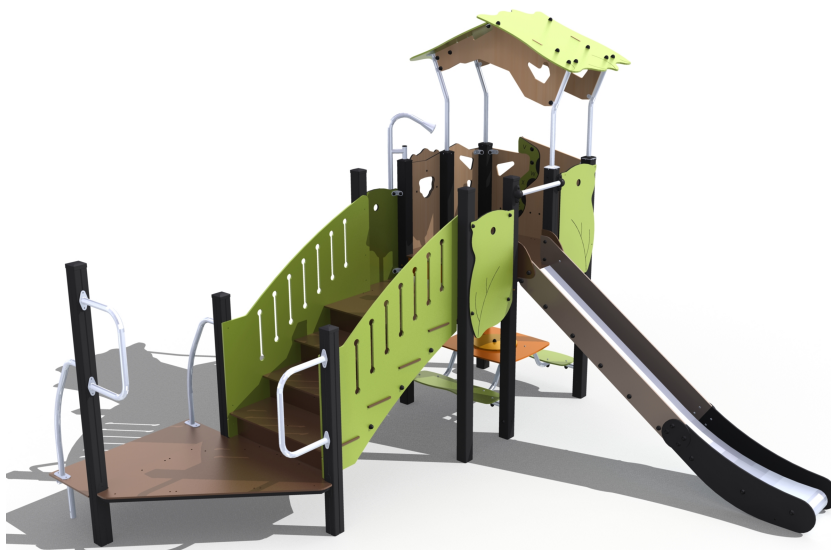
Illustrazione 4: Gioco multifunzione

Costituito da strutture in acciaio e pannelli in HPL, presenta uno scivolo, una torretta una scala con maniglioni per l'accesso facilitato, un tavolo con panche sotto la torre accessibile