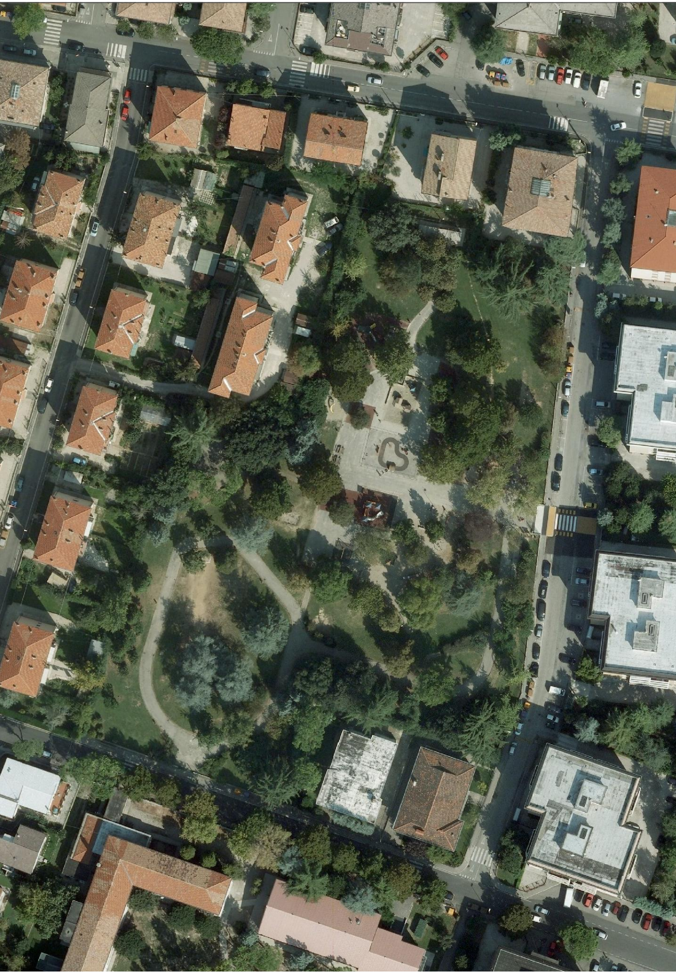
Aerofotogrammetrico - sc. 1:1000