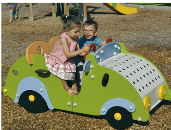
Illustrazione 6: Automobilina

Costituita da pannelli in legno multistrato verniciati a spruzzo con vernici poliuretatiche a base d'acqua, con pianali e i seggiolini ricavati da pannelli in HPL, cofano in lamiera di alluminio da 3 mm