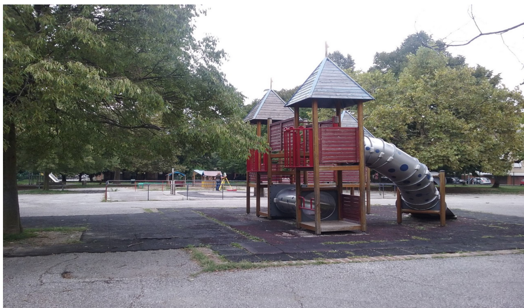
Illustrazione 2: Gioco multifunzione molto utilizzato