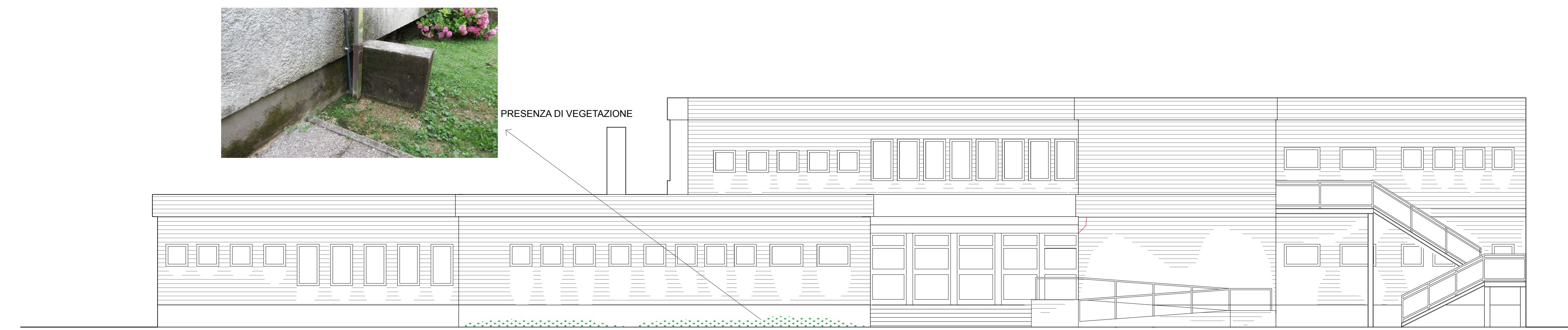
PROSPETTO SUD SCALA 1:100