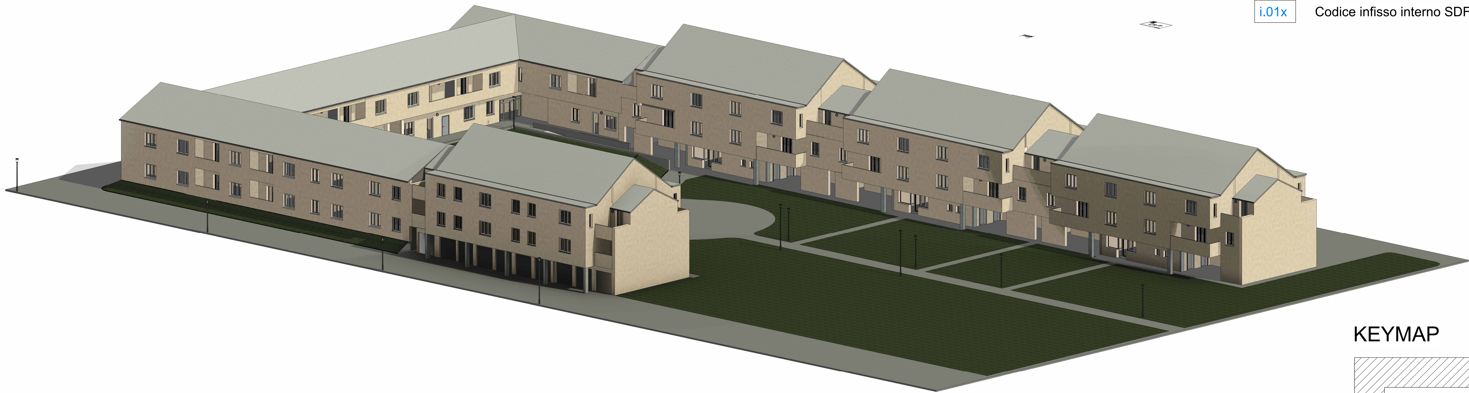
Vista 3D scala 1:200