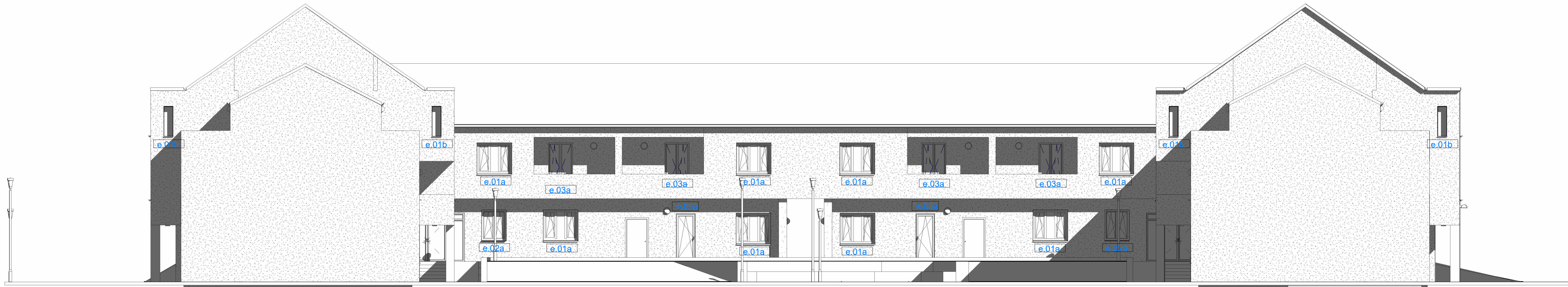
Prospetto EST esterno scala 1:100