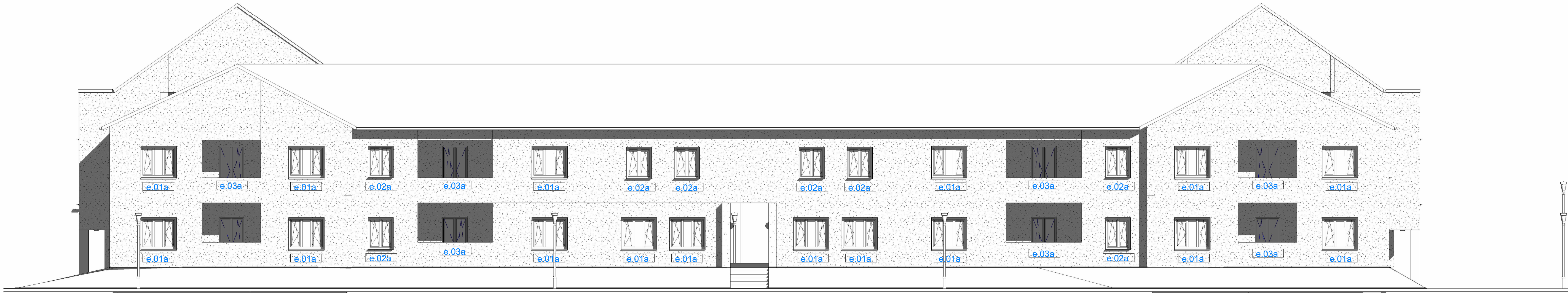
Prospetto OVEST esterno scala 1:100