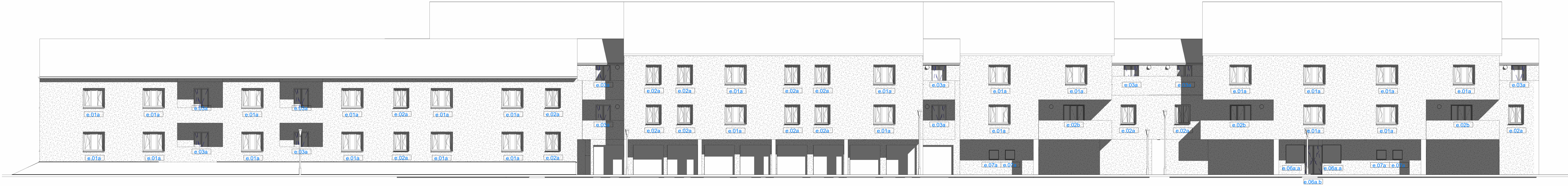
Prospetto SUD esterno scala 1:100