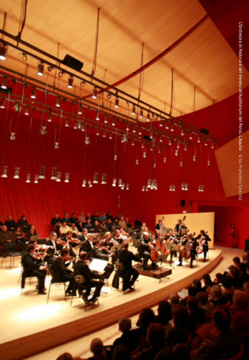
L'Orchestra di Padova e del Veneto all'Auditorium del Parco, L'Aquila