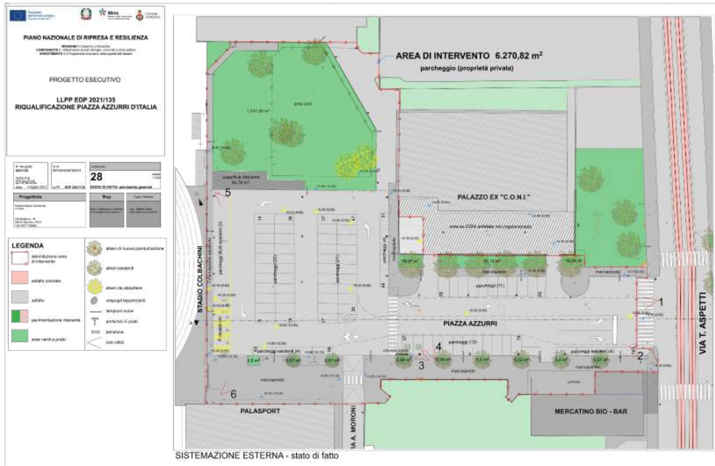
SISTEMAZIONE ESTERNA - stato di fatto (tav. 28 progetto approvato)

PIAZZA_AZZURRI_Rel_TAGLIO ALBERI_R00.docx