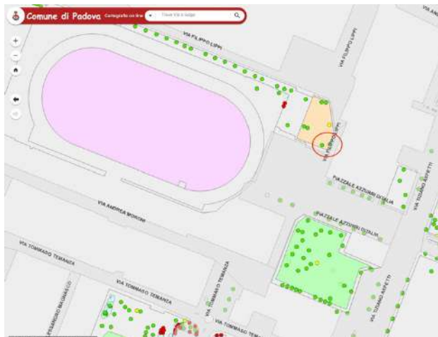
fig. 1) Individuazione delle alberature su planimetria comunale