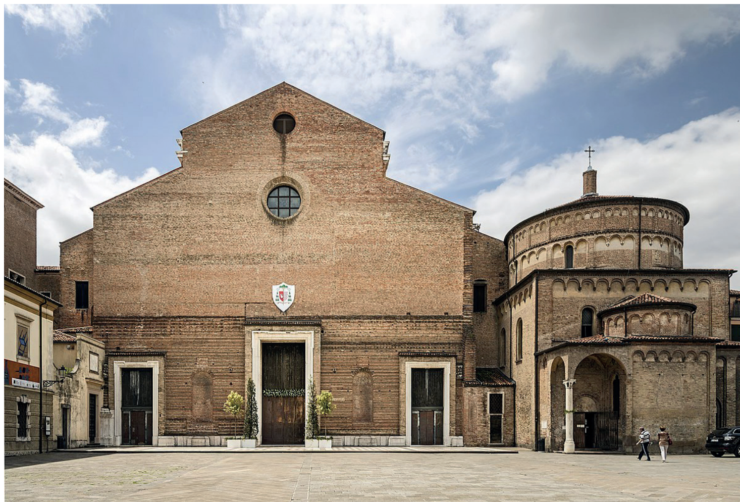
Basilica Cattedrale di Santa Maria Assunta e Battistero di San Giovanni Battista.