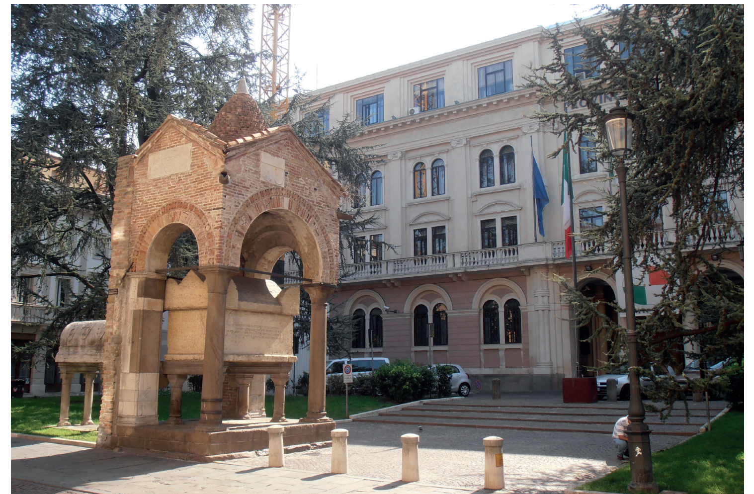
Tomba di Antenore.