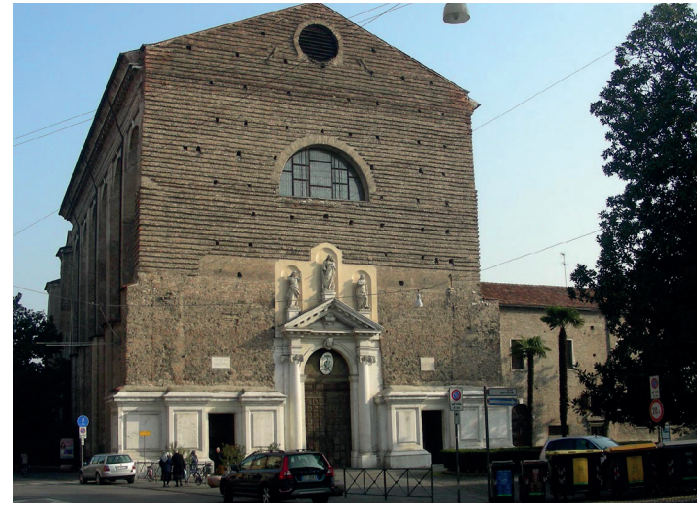
Chiesa di Santa Maria del Carmine, piazza Petrarca.

Il percorso proposto mira a far conoscere un'area del centro della città di Padova caratterizzata dalla presenza di alcuni luoghi nevralgici per la storia locale, con una particolare attenzione al rapporto tra il potere civile e quello religioso. Partiremo dalla Chiesa del Carmine, voluta dall'ordine della Beata Vergine del Monte Carmelo, per proseguire lungo il canale di via Savonarola, e la riviera San Benedetto, su cui si affaccia la chiesa omonima. Si passerà quindi a conoscere la cittadella Carrarese e il palazzo della Ragione, cuore del potere politico di Padova per poi percorrere l'antica via Annia, oggi via Altinate con l'antica chiesa di Santa Sofia. Il percorso proseguirà con il passaggio davanti al monumento di Antenore, mitico fondatore di Padova e l'Università del Bo'. L'ultima parte dell'itinerario toccherà l'area del Duomo, sede del potere vescovile, per ritornare sulla riviera di San Benedetto e concludersi con un ideale anello, alla chiesa del Carmine e l'area degli antichi Mulini.