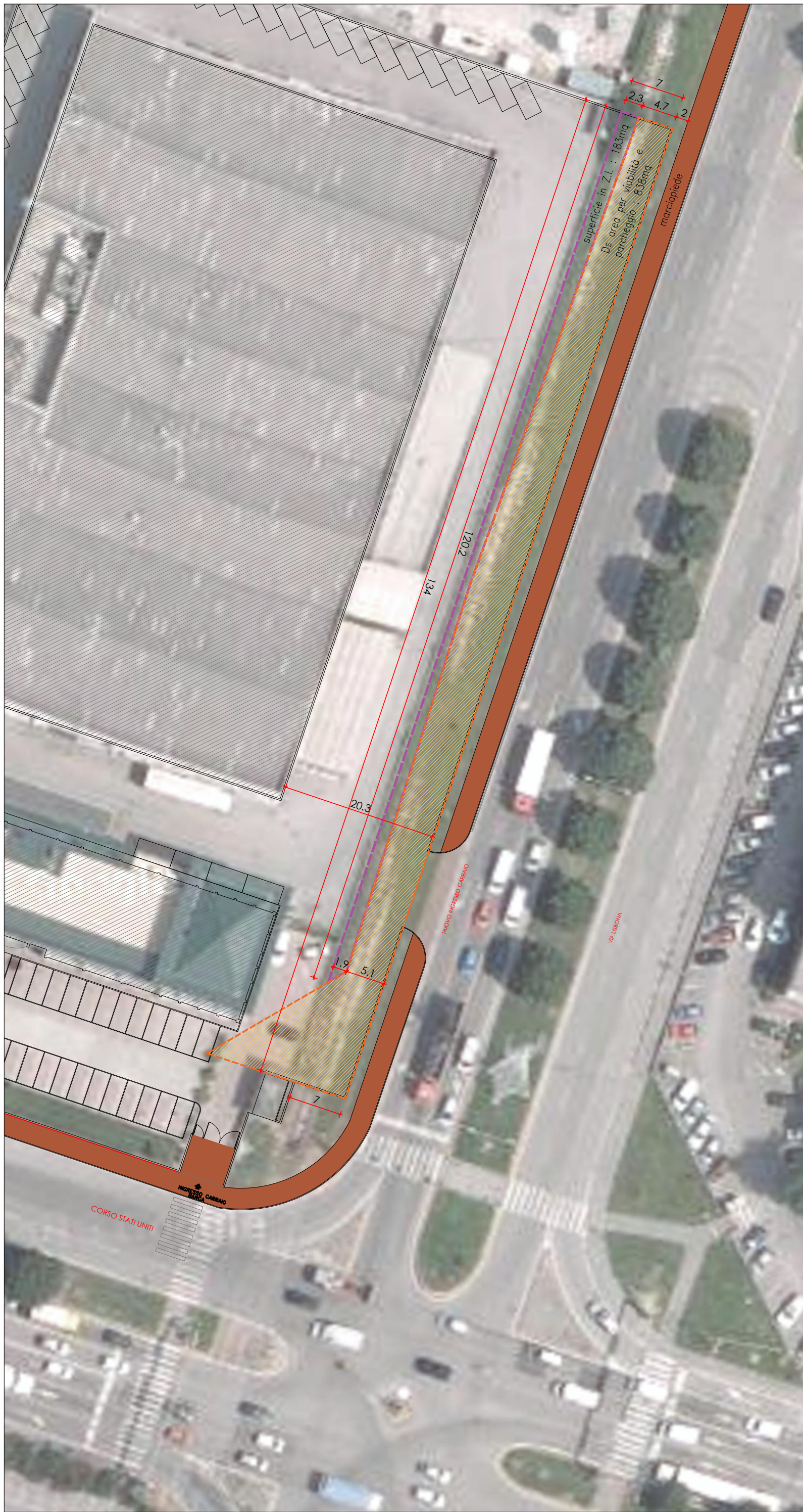
SOVRAPPOSIZIONE PROGETTO - FOTOPIANO