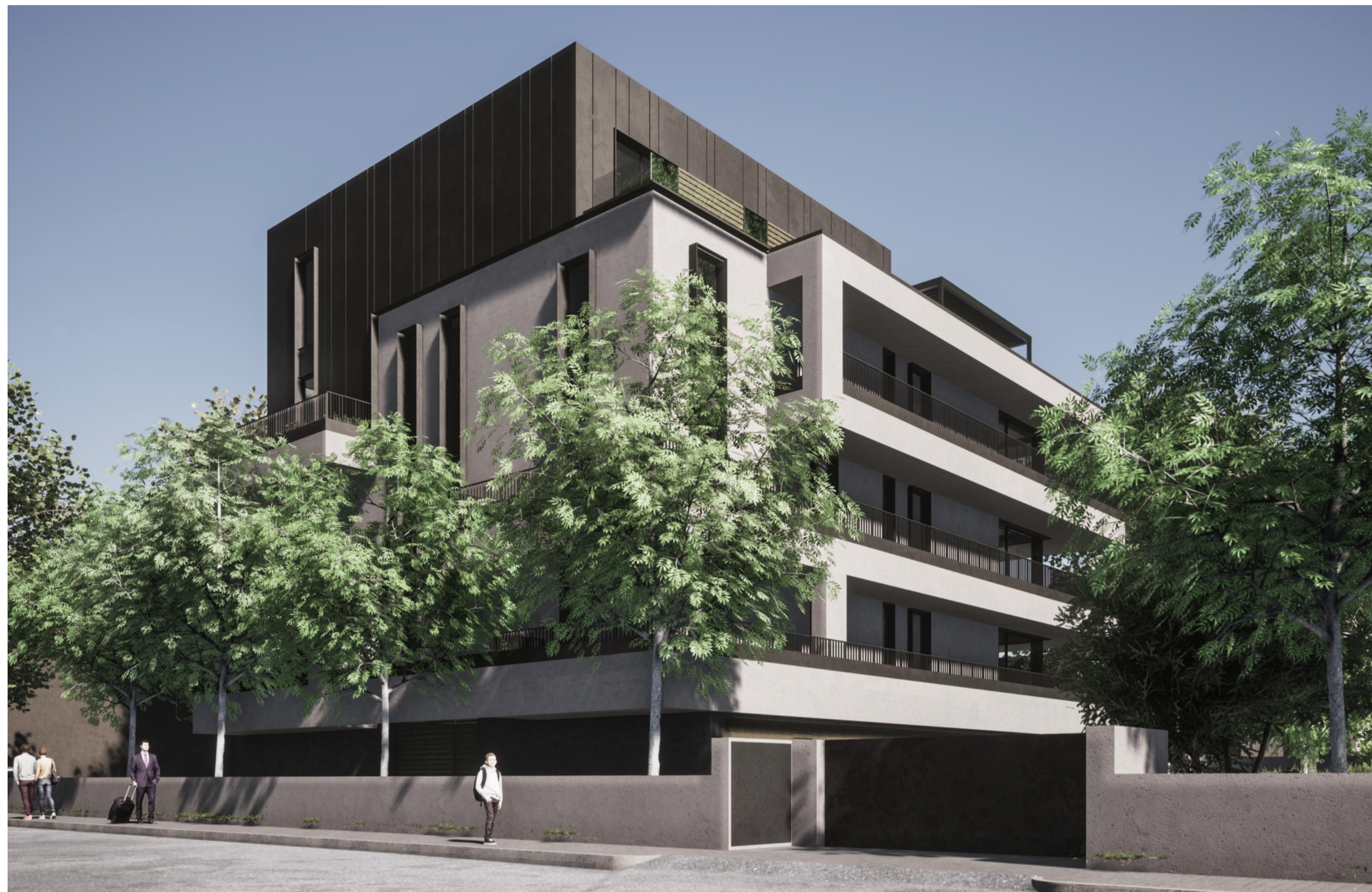
VISTA DA VIA GARIGLIANO