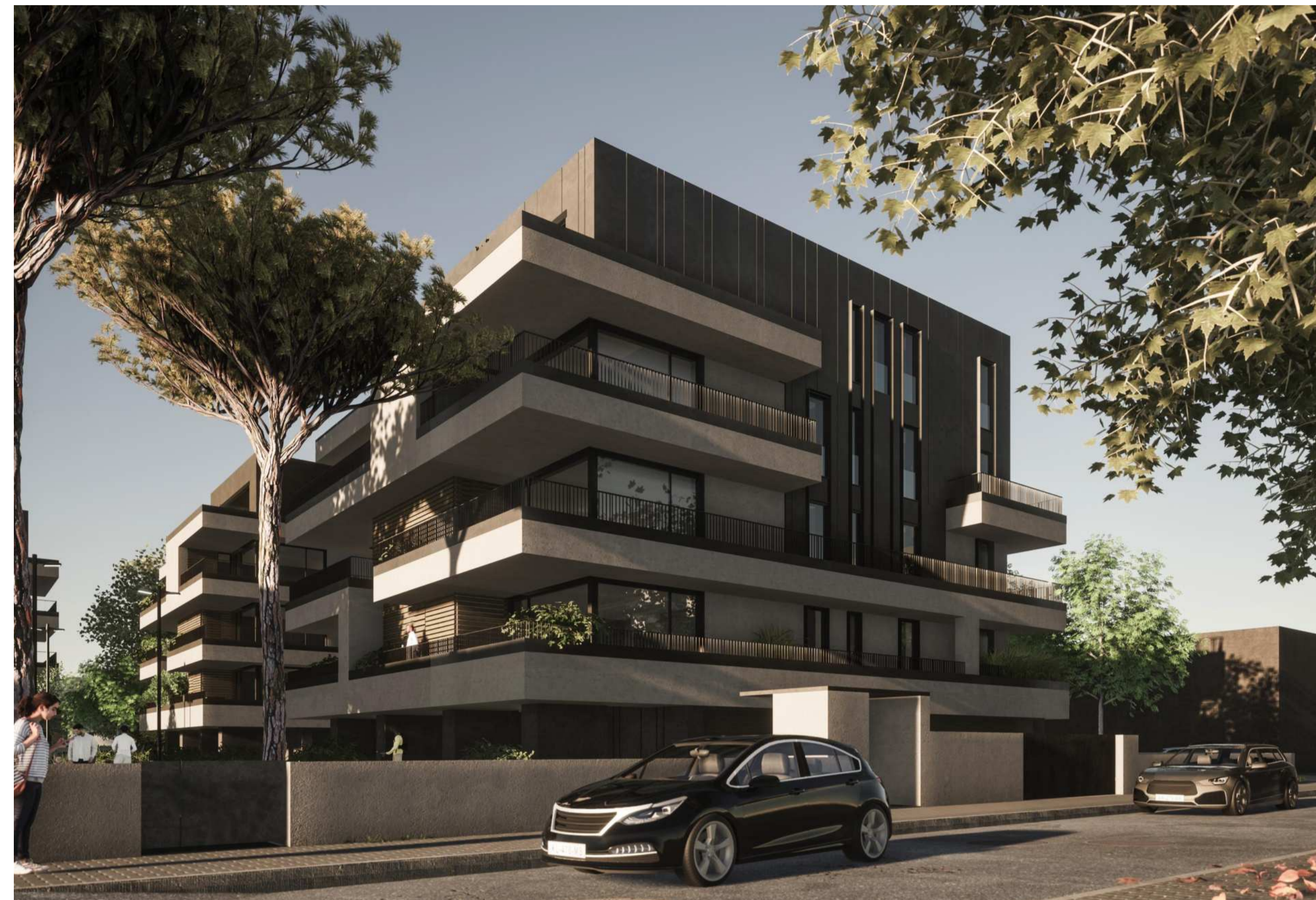
VISTA DA VIA CAPRERA