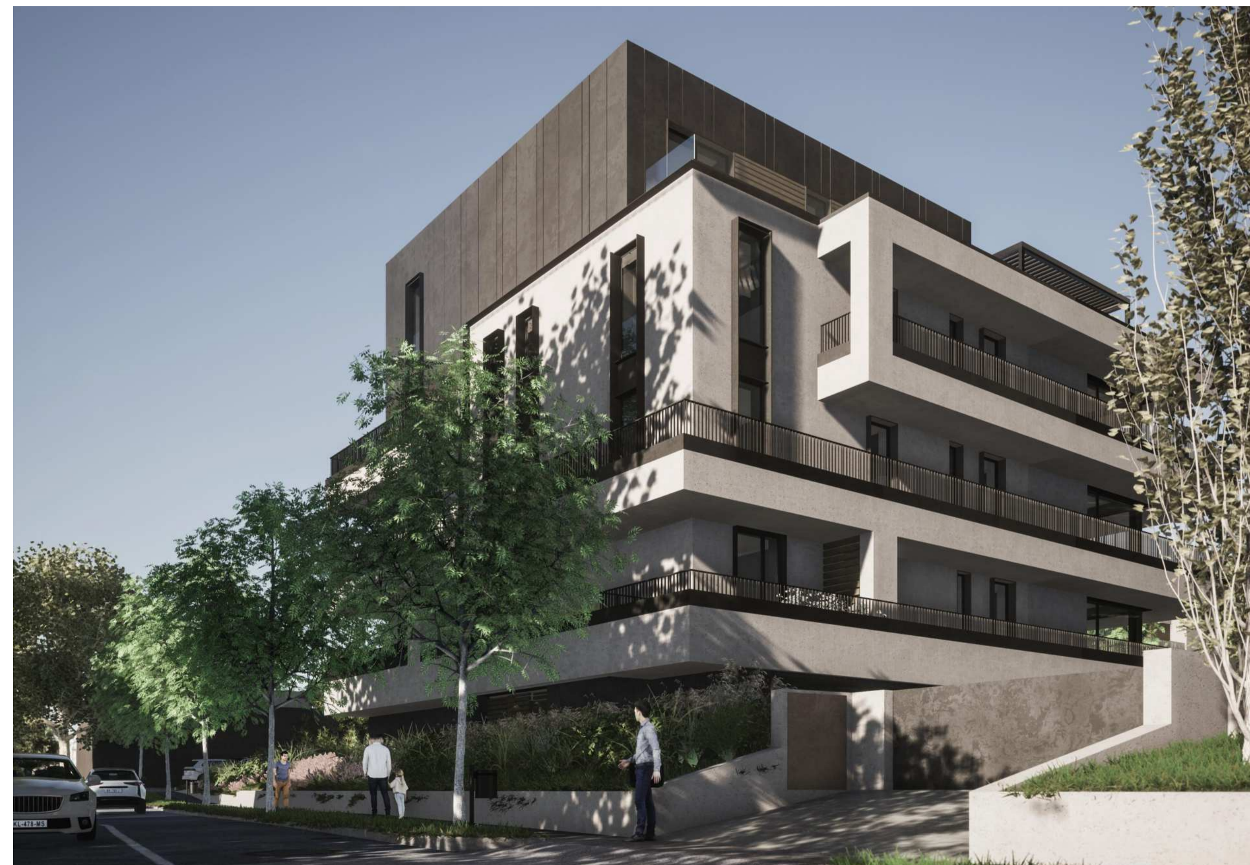
VISTA DA VIA MAKALLÈ