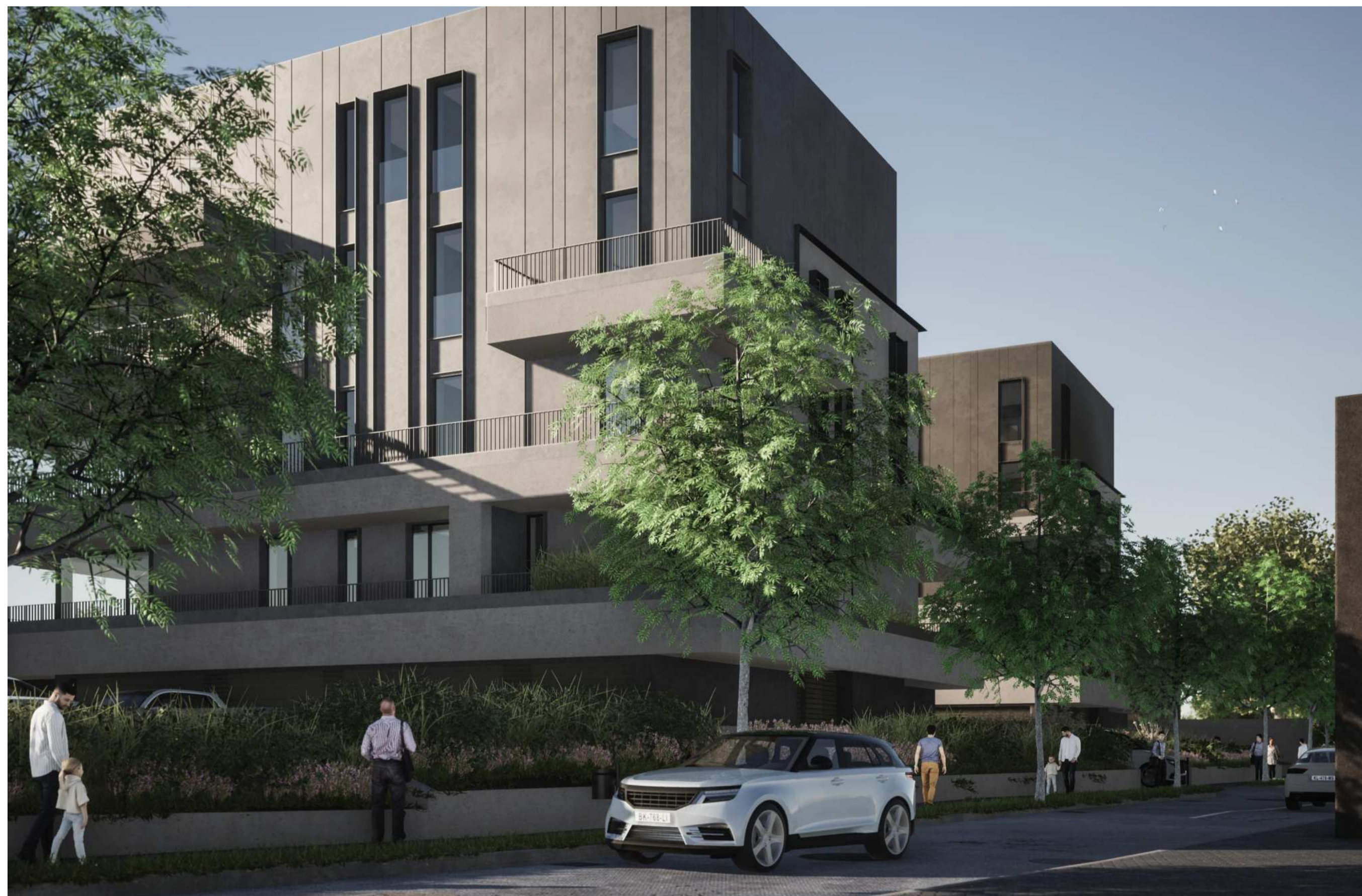
VISTA DA VIA MAKALLÈ