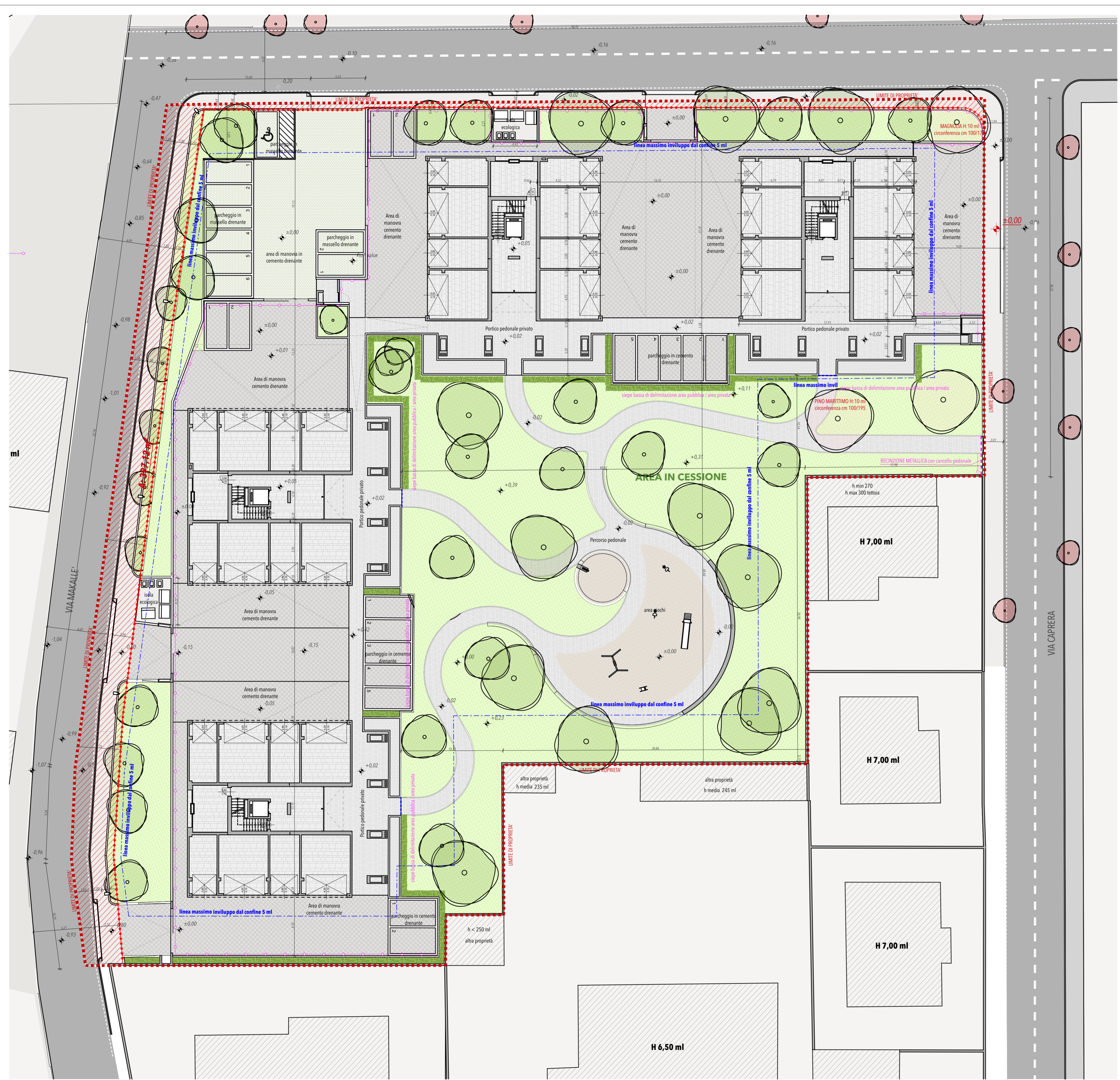
ATTACCO A TERRA_1:200