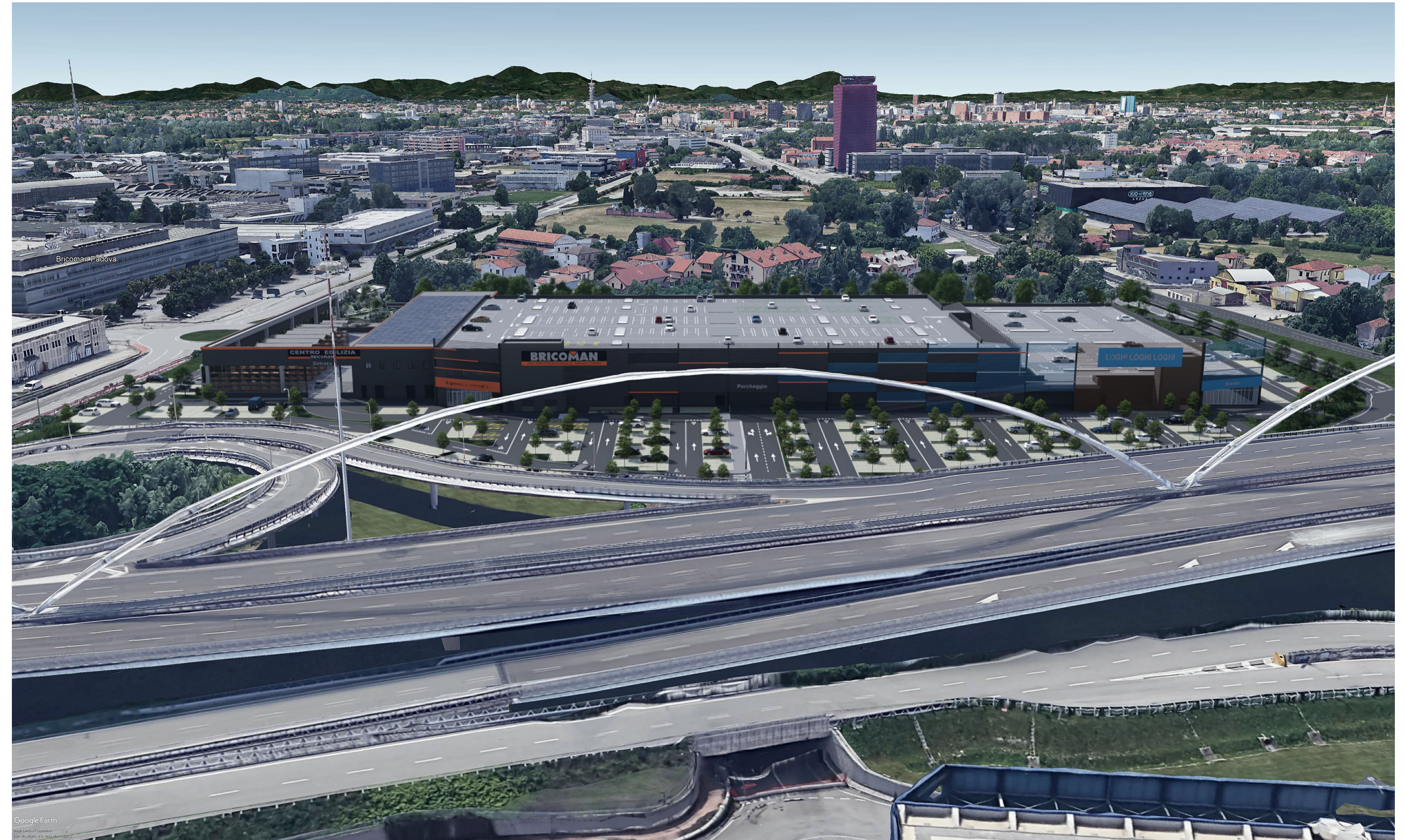
2 Vista Est