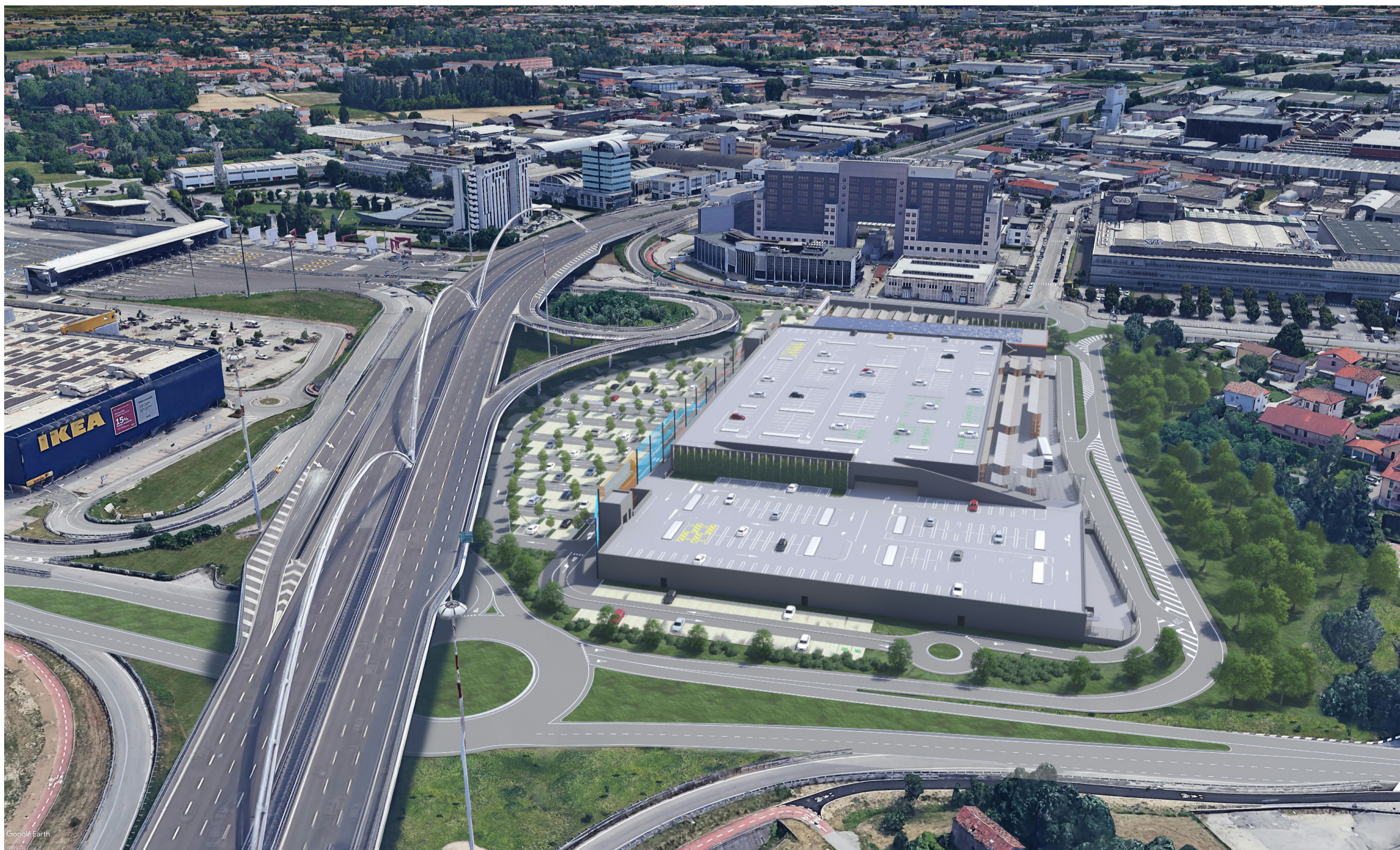
3 Vista Nord - Ovest