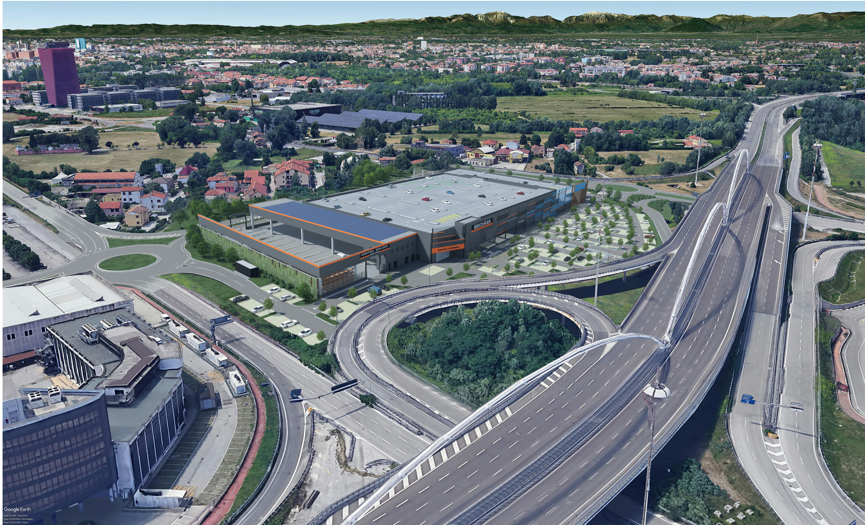
1 Vista Sud - Est