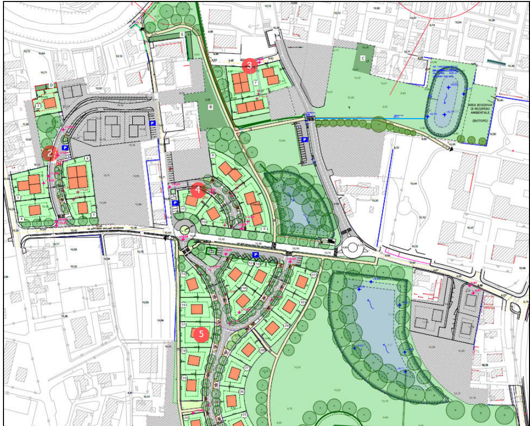
Figura 2: estratto elaborati di variante illustranti i bacini di laminazione.

Per quanto riguarda il sistema di collettamento e di laminazione delle acque meteoriche si segnala che in Variante esso è stato opportunamente adattato alla configurazione planivolumetrica sviluppata, nel rispetto dei pareri citati, rispettando i volumi di invaso e i diametri minimi previsti da progetto per una funzionale gestione della portata meteorica generabile.