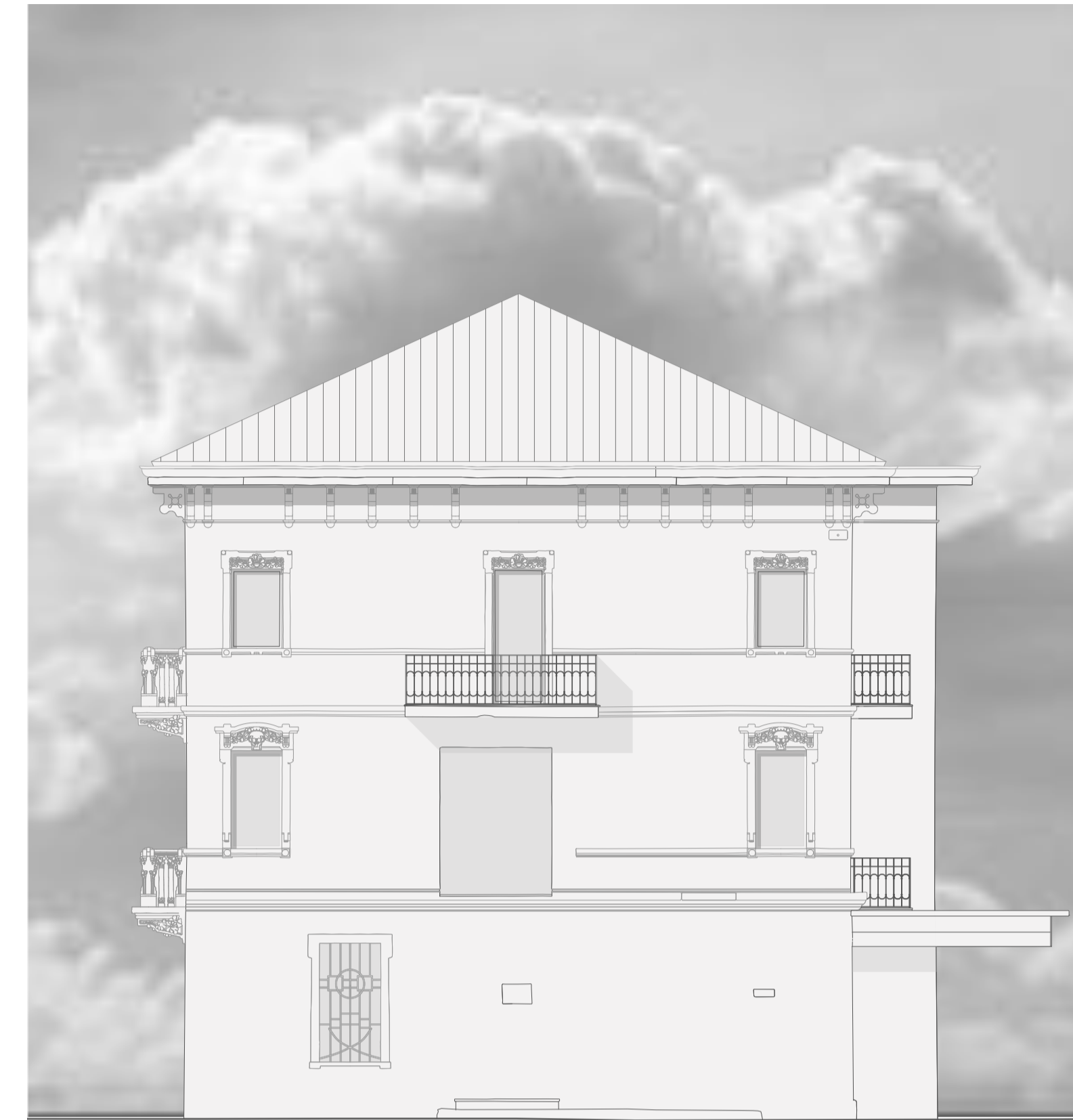
Prospetto Ovest Palazzina Est SDF 1:200