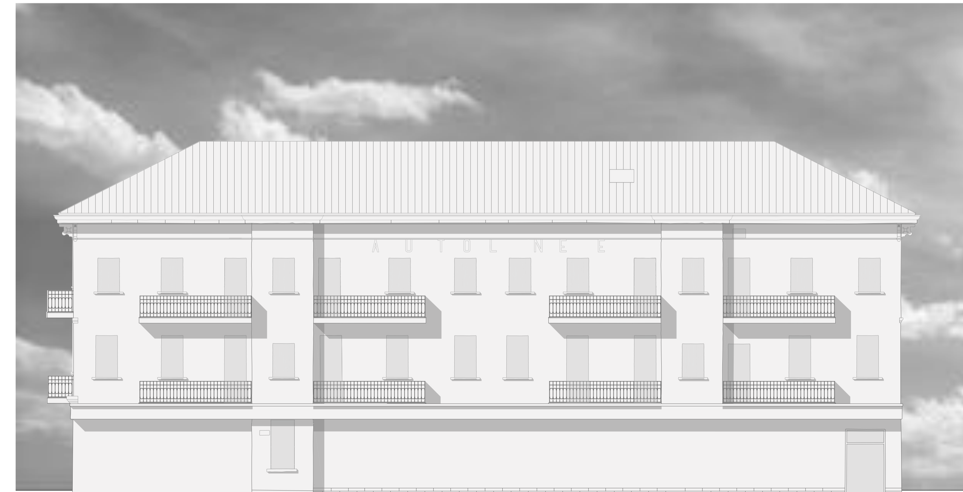
Prospetto Sud Palazzina Est SDF 1:200