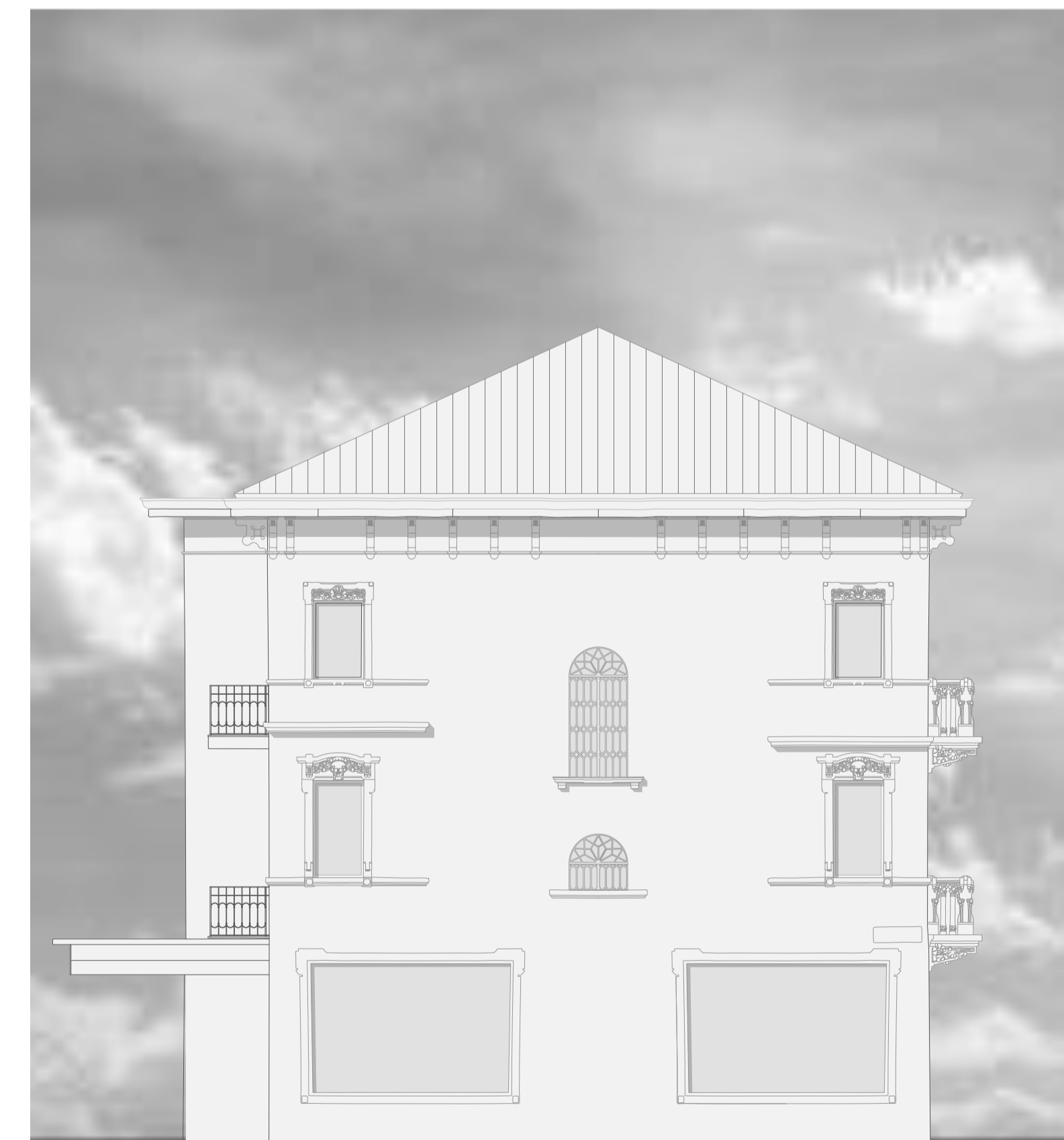
Prospetto Est Palazzina Est SDF 1:200