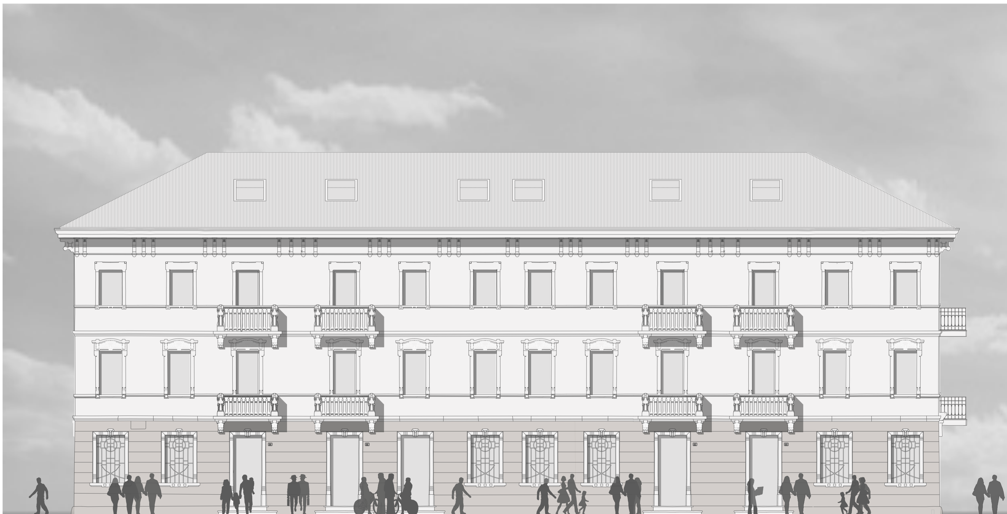
Prospetto Nord Palazzina Est PROGETTO 1:200