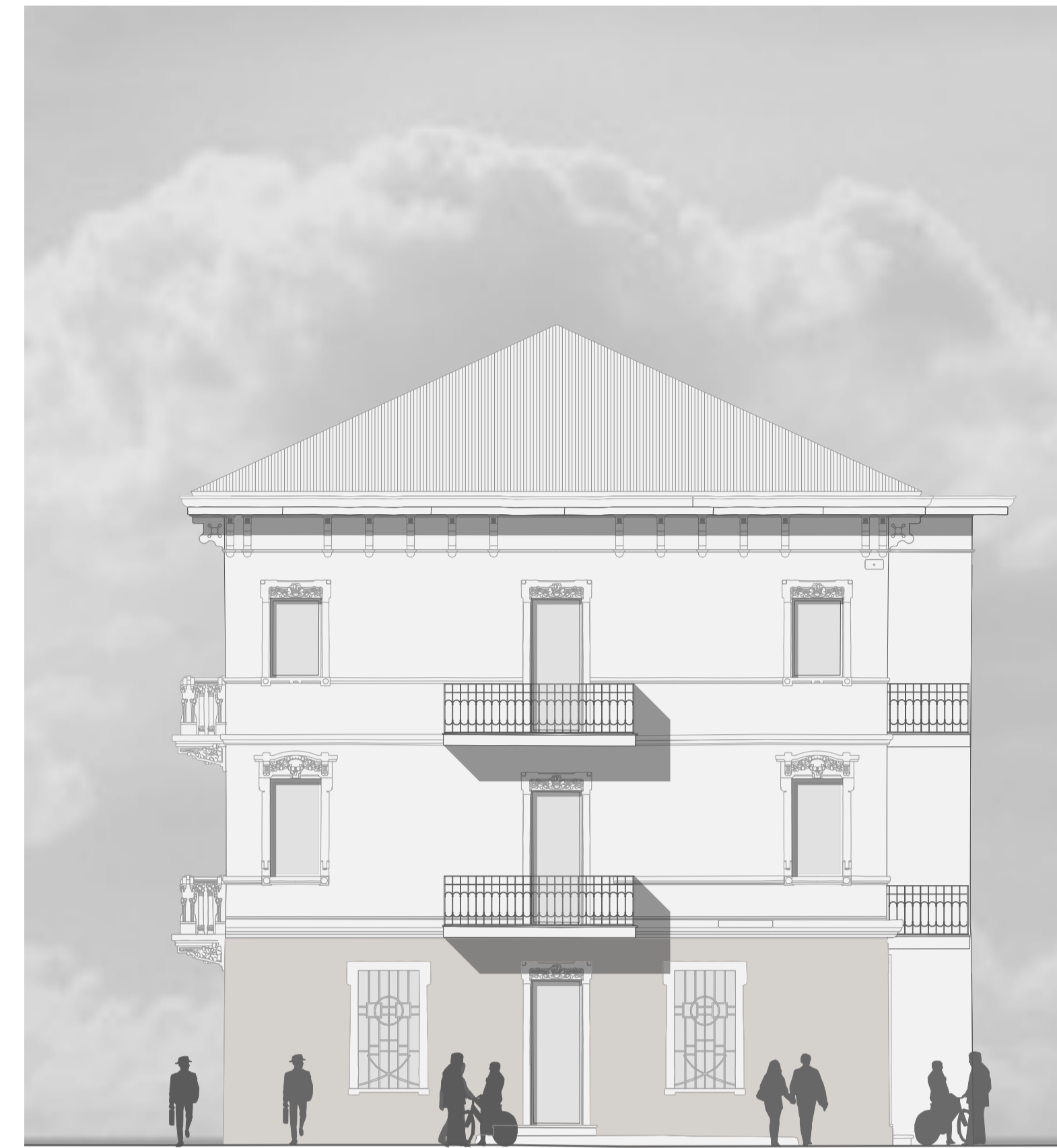
Prospetto Ovest Palazzina Est PROGETTO 1:200