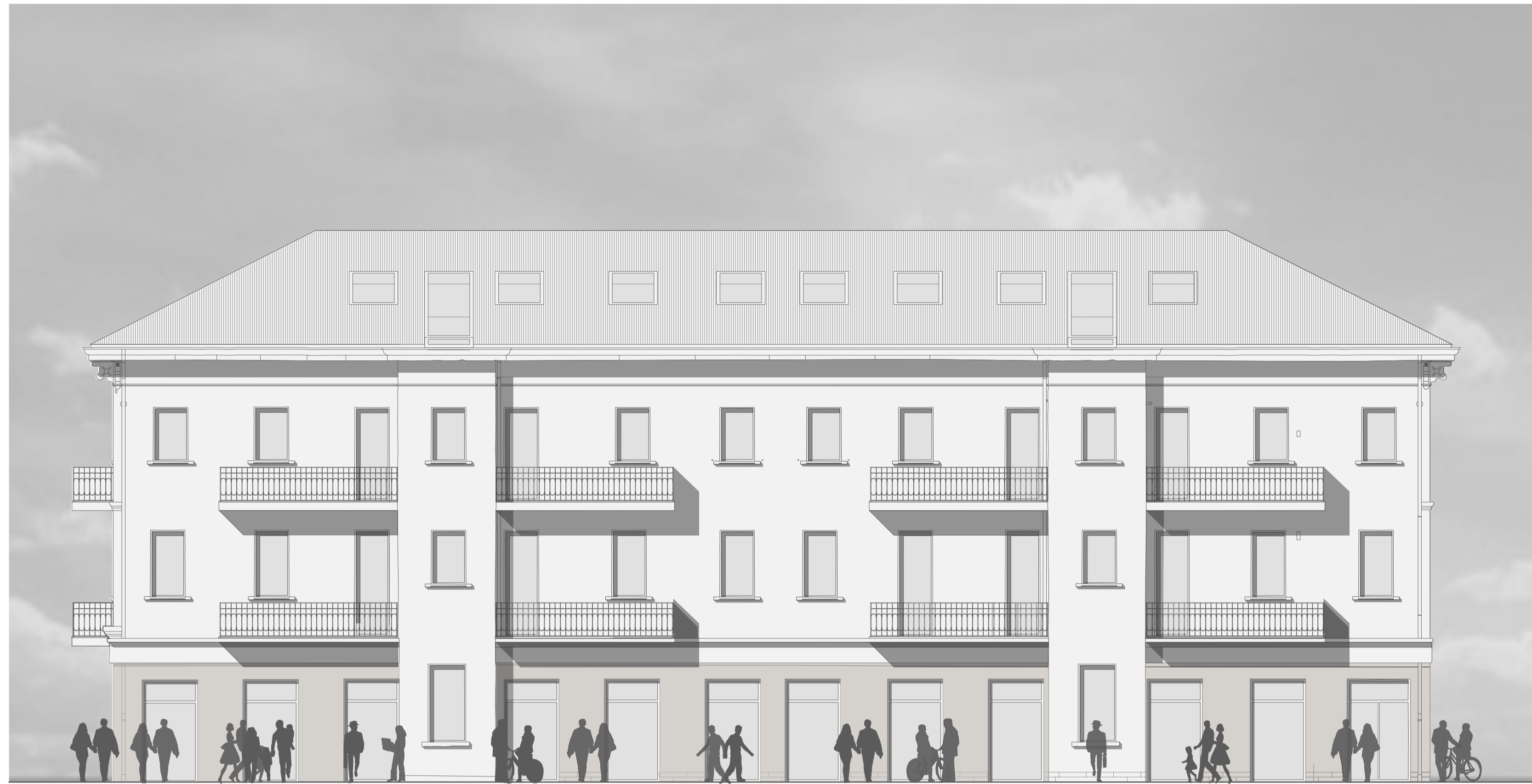
Prospetto Sud Palazzina Est PROGETTO 1:200