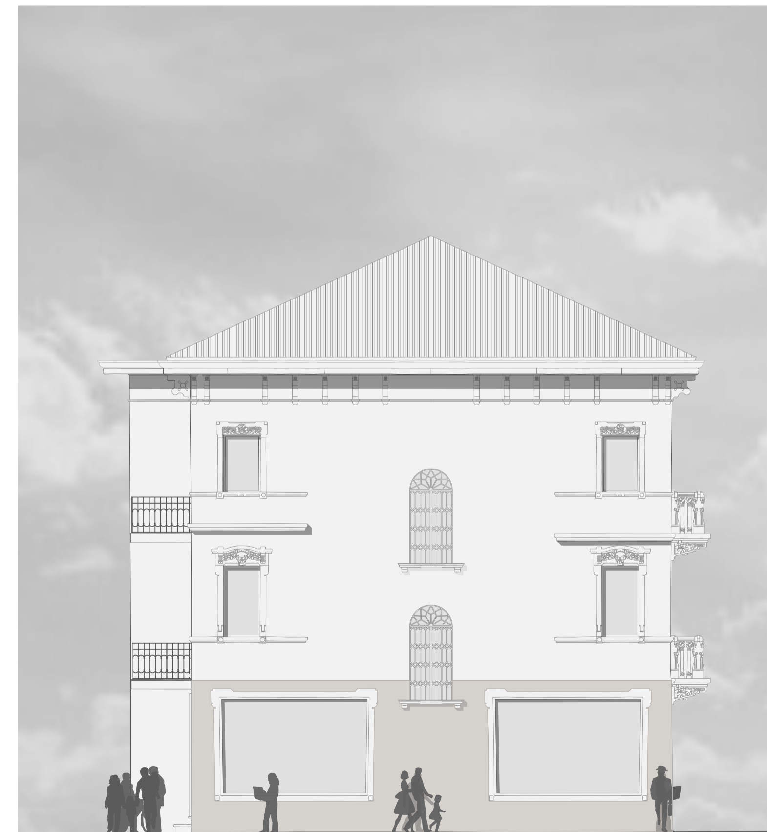
Prospetto Est Palazzina Est PROGETTO 1:200